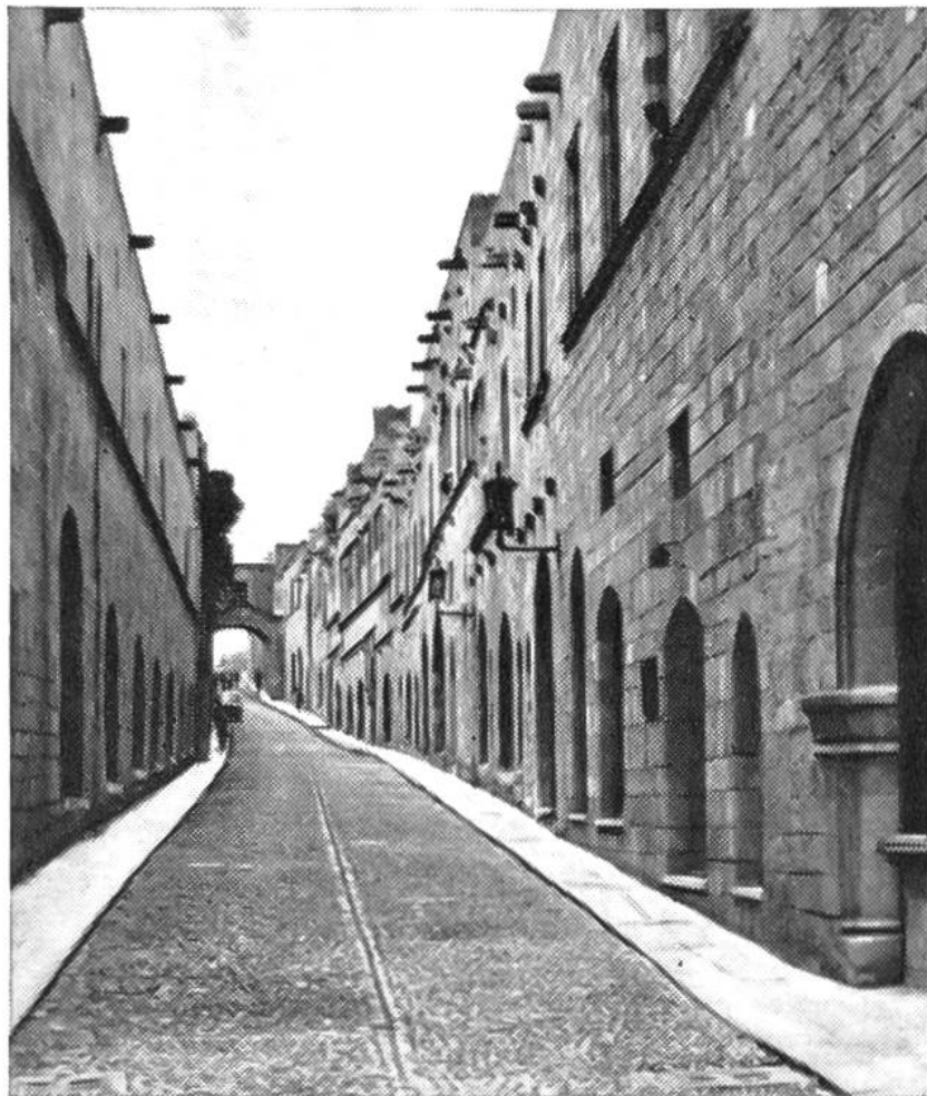
La via dei cavalieri rappresenta un gioiello storico di Rodi, un'unica testimonianza di particolare costruzione medioevale.

distinte: quella nuova, dovuta agli Italiani, in seguito alle costruzioni di quartieri con meravigliosi giardini e quella antica, dovuta all'epoca delle Crociate. La parte più interessante della vecchia città è l'antica strada dei cavalieri, lunga 200 metri, con le case dei diversi ordini, costituiti dai cavalieri, dai fratelli caritatevoli e dai sacerdoti. Ogni ordine costituiva suddivisioni nazionali o «lingue». Così, oggi ancora, si osservano lungo la strada, le case o i rifugi delle diverse nazioni. All'inizio, in basso, si trova l'ospedale dei cavalieri, oggi sede di un museo e vi si ammira una immensa corte interna, quadrata. Da una parte e dall'altra della strada sono allineate le diverse case: quella degli Spagnuoli, poi quella particolarmente decorata dei Francesi. Seguono le case dei cavalieri Italiani, di quelli di Provenza e di altri paesi. Sono tutte case in pietra, in stile gotico e si presentano intatte, almeno nella facciata. Testimoniano la grande epoca delle Crociate.