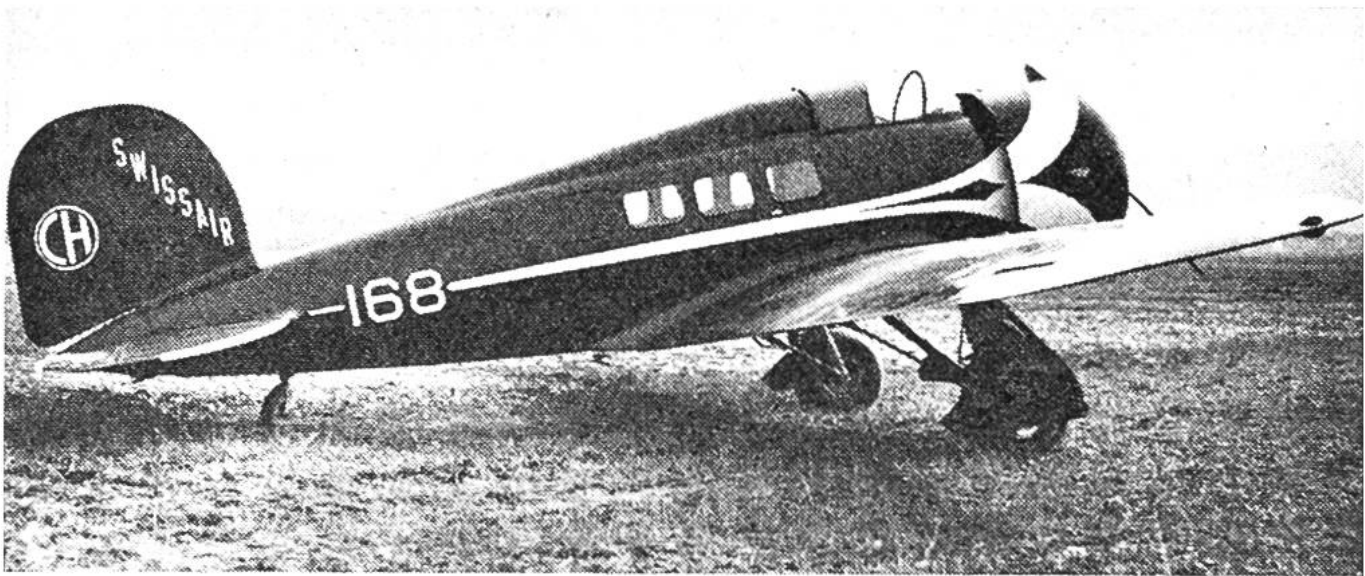
Der Lockheed-Orion, das erste amerikanische Verkehrsflugzeug in Europa. Es wurde von der Swissair 1932 in Betrieb genommen.

der verschiedenen Gesellschaften im Linienverkehr ähneln sich zu stark, als dass sie die Wahl der Passagiere entscheidend zu beeinflussen vermöchten. Die Tarife aller bedeutenden Luftfahrtbetriebe sind gleich. Eine internationale Regelung schliesst Preisunterbietungen aus.