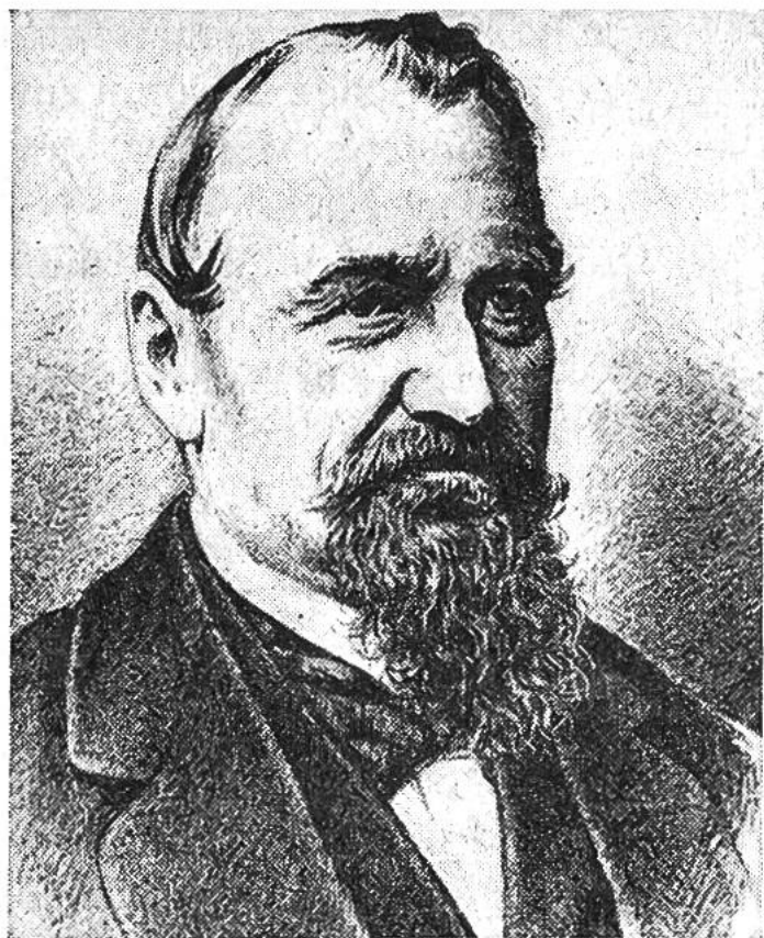
Jakob Dubs, von Affoltern a. A., Bundesrat 1861–1872.

griffen «Vollzug der Gesetzgebung» und «Aufsicht». Dass der mit seinen Aufgaben vertraute Beamte sich nicht mit eingefahrenen Geleisen begnügen kann und darf, sondern stets den Blick auf neue Möglichkeiten ausrichten muss, ist einleuchtend, zumal der Verwaltung auch die Vorbereitung der Gesetzgebung vorgeschrieben ist. In einer Demokratie wie der schweizerischen, die stets darauf bedacht sein muss, die Zustimmung der Bürger zu erhalten, verlangt dies ein be-