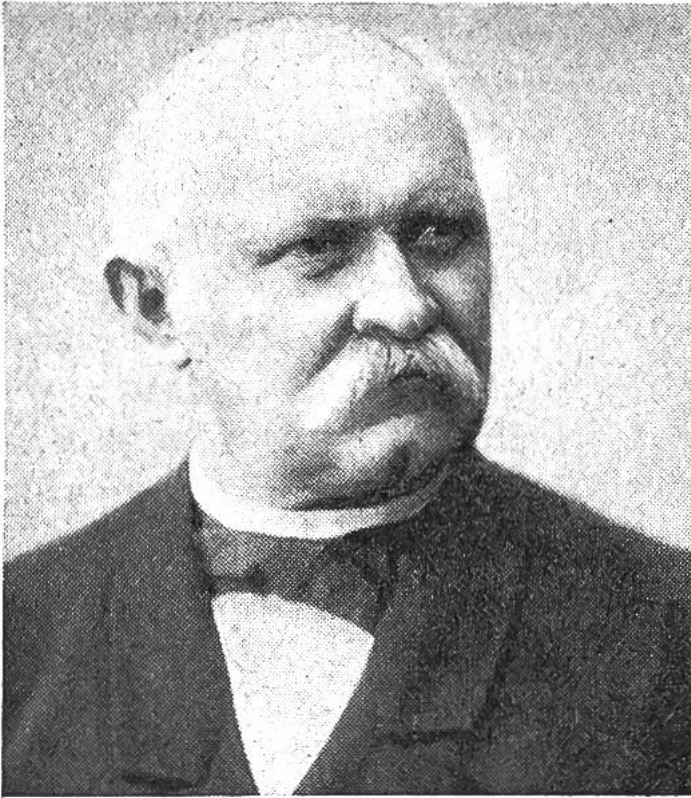
Emil Welti, von Zurzach, Bundesrat 1866–1891.

den Bahnbau der privaten Initiative, also dem privaten Unternehmertum, die Finanzierung zu einem erheblichen Teil ausländischen Geldgebern, die Vollmacht jedoch, den Bau und den Betrieb zu bewilligen (d. h. Konzessionen zu erteilen), den Kantonen zu überlassen. Man schrak davor zurück, den Schwerpunkt der Verkehrspolitik auf den Bund zu übertragen, aus Angst, das zu starke Anwachsen der Bürokratie könnte den Bund übermächtig werden lassen. In den ersten Staatskalendern nach 1849 gab es noch kein Post- und Eisenbahndepartement, sondern ein Post- und Baudepartement. Sein erster Chef war Bundesrat Wilhelm Matthias Naeff. Jahre hindurch hatte er die Funktionen des Generalpostmeisters selbst zu versehen. Markante Persönlichkeiten, die sich als Bundesräte um die Gestaltung des Verkehrswesens in der Pionierzeit verdient machten, waren ferner Jakob Dubs, Verfasser der Botschaft zum Eisenbahngesetz vom 23. Dezember 1872, welches das Recht zur Erteilung von Eisenbahnkonzessionen auf den Bund übertrug, Karl Schenk, der einige Jahre das Eisenbahn- und Handelsdepartement leitete; Emil Welti war der erste Vorsteher des Post- und Eisenbahndepartements; Joseph Zemp bleibt in der Eisenbahngeschichte mit