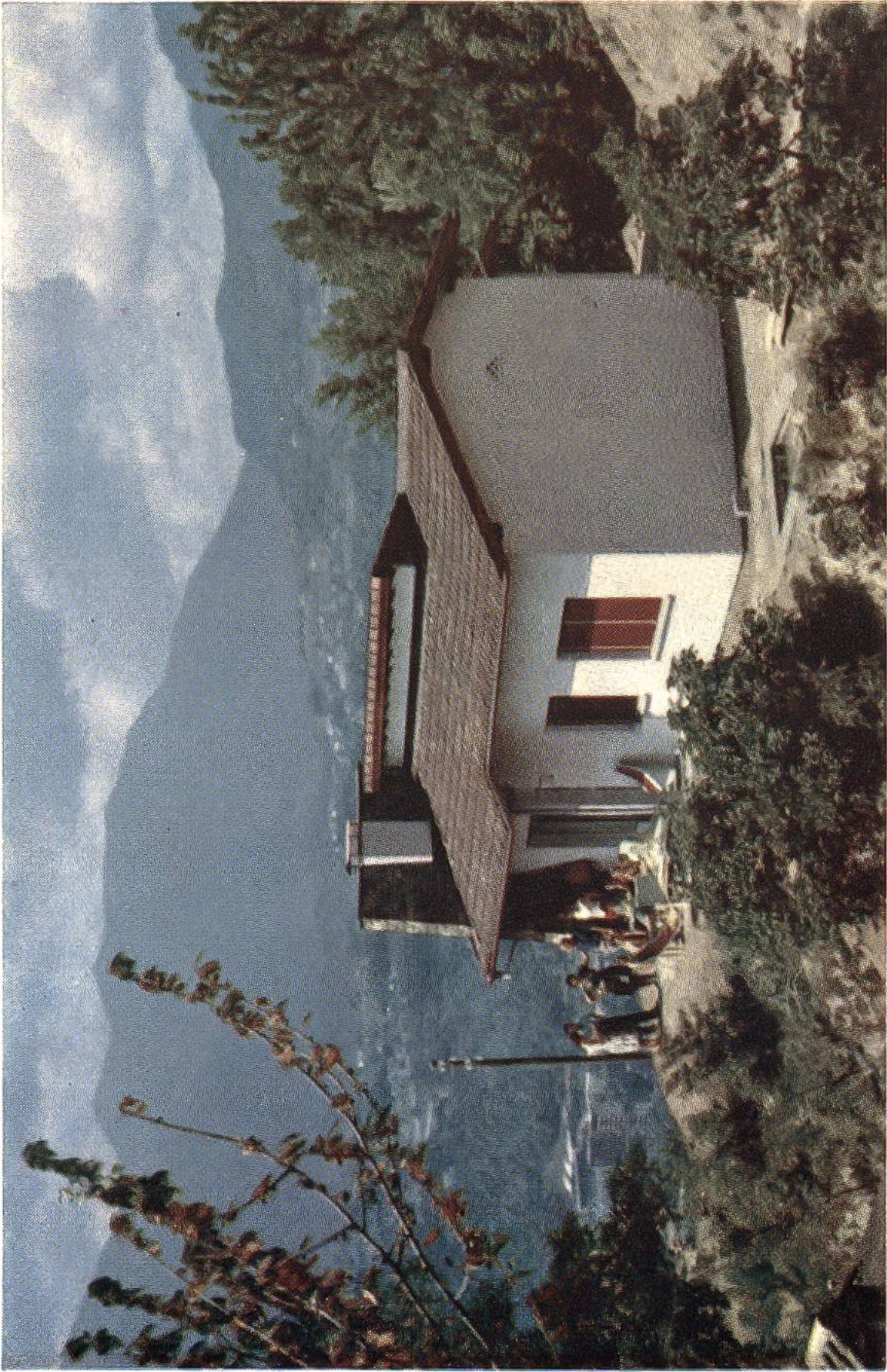
Die «Casa Sciaffusa» im Feriendorf der 25 Kantone in Albonago ob Lugano, das die Schweizer Reisekasse speziell für Ferienaufenthalte kinderreicher Familien erbaut hat.