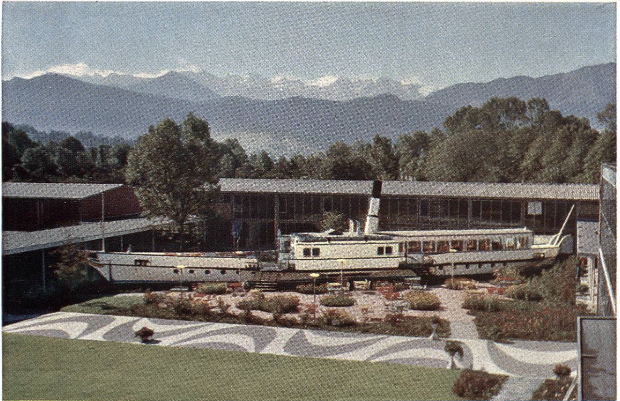
Gartenhof des am Ende der Seepromenade Luzerns gelegenen Verkehrshauses der Schweiz (Schweizerisches Verkehrsmuseum) mit dem Dampfschiff «Rigi», dem ältesten Dampfschiff der Schweiz (1847).