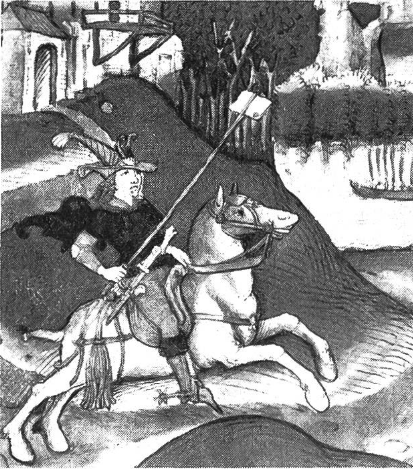
Briefbote mit der Absage des Grafen Gerhard von Valendis an die Stadt Bern im Laupenkrieg 1339.