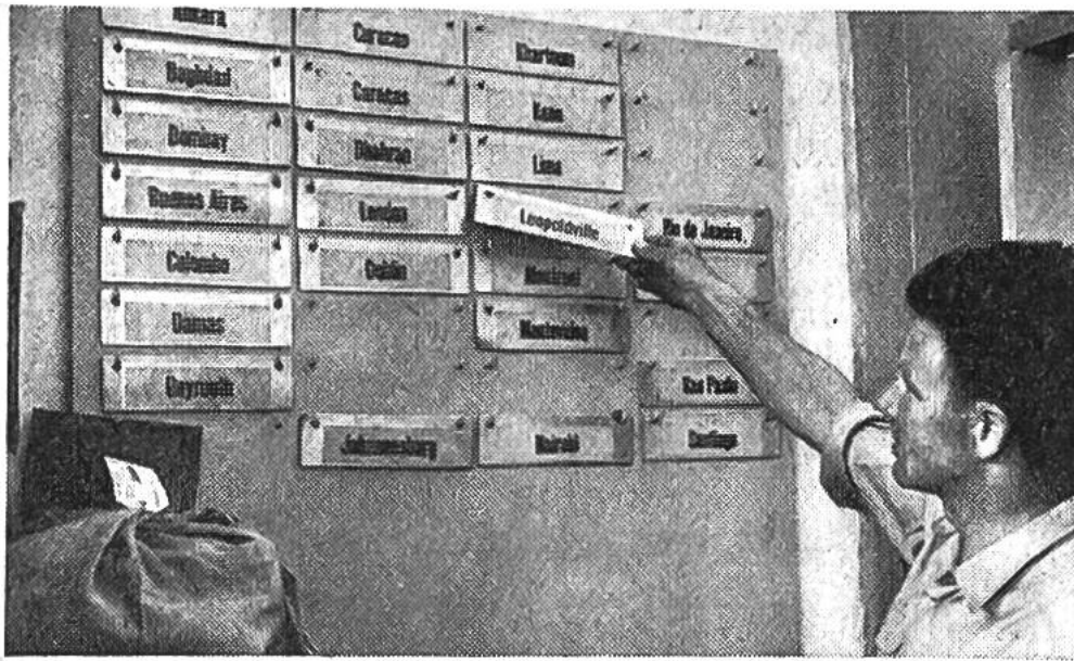
Flughafenpostamt Zürich 58; Anschriften nach aller Welt.

(1861/1862), die Expressendungen (1868), die Feldpost (1870), die Postkarte (1870), der Postcheckdienst (1906), die Rohrpost (1926) usw.