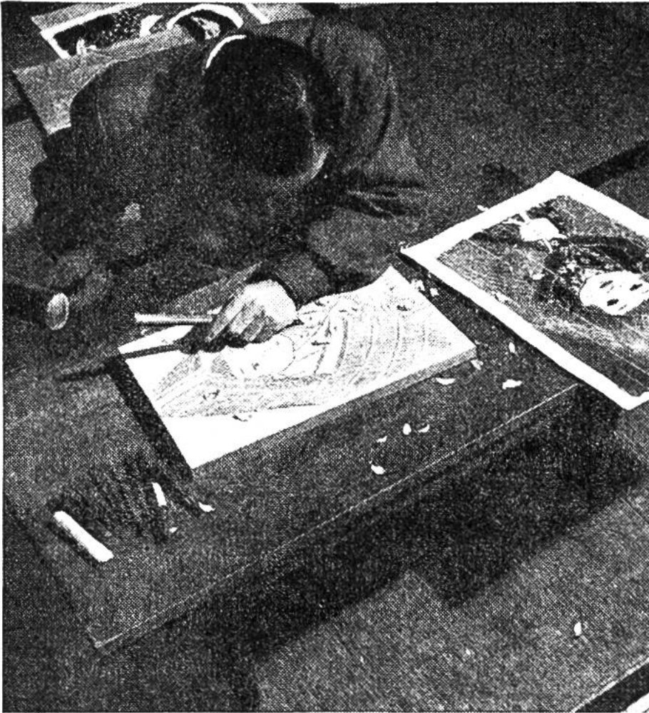
Der Holzschnit- der beim Schnit- zen der ersten Schwarz-Weiss- Druckplatte auf Langholz.