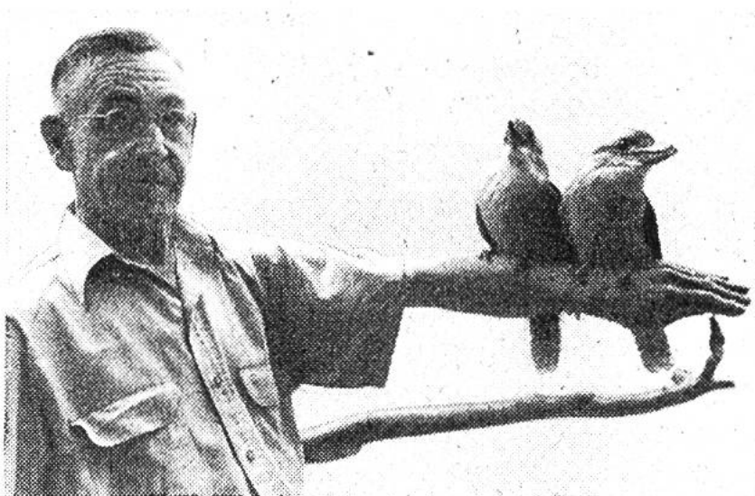
Diese zahmen «Lachenden Hänse» betrachten den Arm ihres Pflegers als einen Ast, auf den man sich setzen kann.

Auch der Mensch spielt, wie erwähnt, in der Tiergarten-Biologie eine Rolle. Schliesslich baut man ja zoologische Gärten in erster