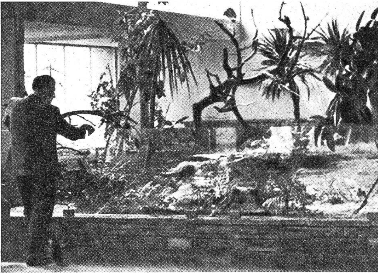
Immer mehr kommt die gruppenweise Haltung von Vögeln in offenen Flugräumen zur Anwendung (Zoo Zürich 1954).

Ersatzfutter noch nicht entdeckt; entsprechend selten sind einstweilen Zuchterfolge. Koalas, die beliebten australischen Beuteltiere, kann man nur in Ländern halten, in denen die richtigen Eukalyptusbäume wachsen, weil diese Tiere nur frische Blätter bestimmter Eukalyptus-Arten fressen. Ausserhalb Australiens gibt es daher nur in kalifornischen Zoos Koalas. Vielleicht wird es später gelingen, den entzückenden Pfleglingen die lebenswichtigen Stoffe in Tablettenform mit anderem Futter anzubieten. Aber die zweckmässige Ernährung der Tiere im Zoo ist nur eine der vielen Aufgaben der Tiergarten-Biologie. Ebenso wichtig ist zum Beispiel die zweckmässige und ansprechende Unterbringung. Während man früher die Menagerie-Tiere in eisenstangenstarreren «Zwingern» einzusperren pflegte, bemüht man sich heute, sie in möglichst natürlichen, geräumigen, hübsch umpflanzten Anlagen zu halten, in Naturausschnitten, die alles für das Tier Wesentliche enthalten, mit Schwimm-, Kletter-, Grab- oder Lauf-