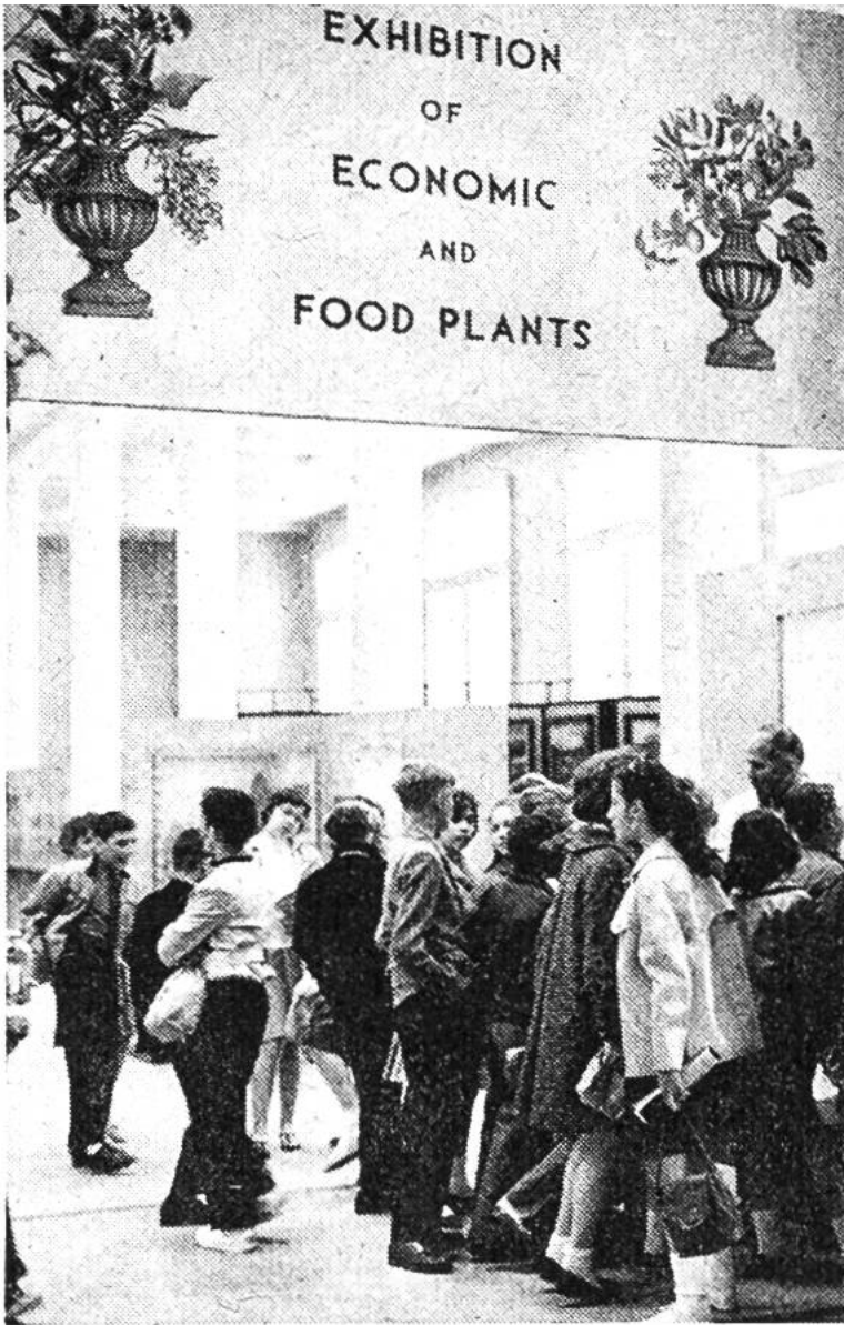
Im Museum des Botanischen Gartens von New York bemüht man sich, durch Sonderausstellungen, z.B. über wirtschaftlich wertvolle Pflanzen, insbesondere den Kindern die Pflanzenwelt nahezu bringen.

botanischen Garten anlegte, der aber ausdrücklich nur Heilpflanzen enthalten sollte, die zur Herstellung von Drogen benutzt wurden. Die berühmten Kew Gardens in London entstanden erst 1759. Hier wird der wertvolle Index kewensis erstellt, das ist die alphabetische Liste aller uns bekannten blühenden Pflanzen, eine Liste, die noch immer weiter ergänzt wird. Die Gartenleitung veranstaltet Ausstellungen und Kurse und hat schon viele wertvolle Expeditionen ausgeschickt, die für die Erforschung der Pflanzenwelt von Wichtigkeit waren. Man rechnet mit etwa einer Million Besucher pro Jahr.