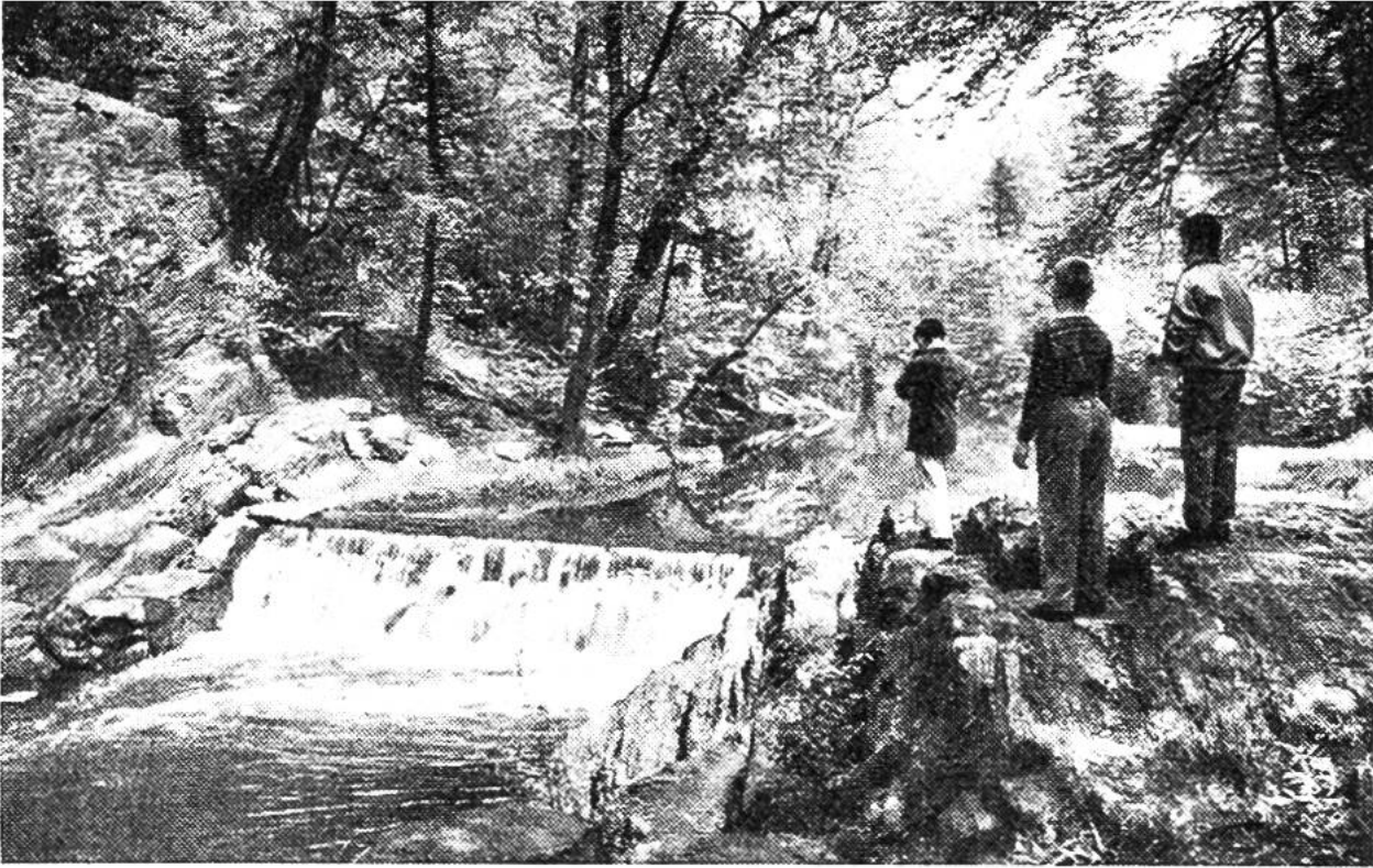
Der Bronx-Fluss im Botanischen Garten von New York ist die einzige Stelle, die noch die Landschaft zeigt, wie sie war, ehe die Stadt, die früher Neu Amsterdam hiess, erbaut wurde.

schen Garten erhalten. Dieser verfiel jedoch nach einiger Zeit. Durch die Naturforschenden Gesellschaften wurde dann erst 1646 der Botanische Garten in Zürich gegründet, im 18. Jahrhundert derjenige von Bern. Jetzt sind die botanischen Gärten oft an Universitäten angeschlossen, da sie den Studierenden das Anschauungs- und Versuchsmaterial liefern können. Dabei zeigte sich sehr bald die Notwendigkeit, das nötige Schrifttum über die Pflanzen in der Nähe zu haben und auch durch Anlegen von Herbarien einen Vergleich mit den Pflanzen zu ermöglichen, die nicht gerade lebend zur Hand sind. So kommt es, dass die jetzigen botanischen Gärten alle mit Bibliotheken und Herbarien ausgestattet sind. Der Botanische Garten von New York hat, den Ausmassen der Stadt entsprechend, die grösste Anzahl Bücher: 65000. Dazu kommen noch etwa 300000 Manuskripte und Kataloge. Das Herbarium umfasst drei Millionen Pflanzen. Seit 1900 werden dort jeden Samstagnachmittag von Oktober bis Mai Kurse und Vorträge abgehalten; ausserdem finden Abendkurse