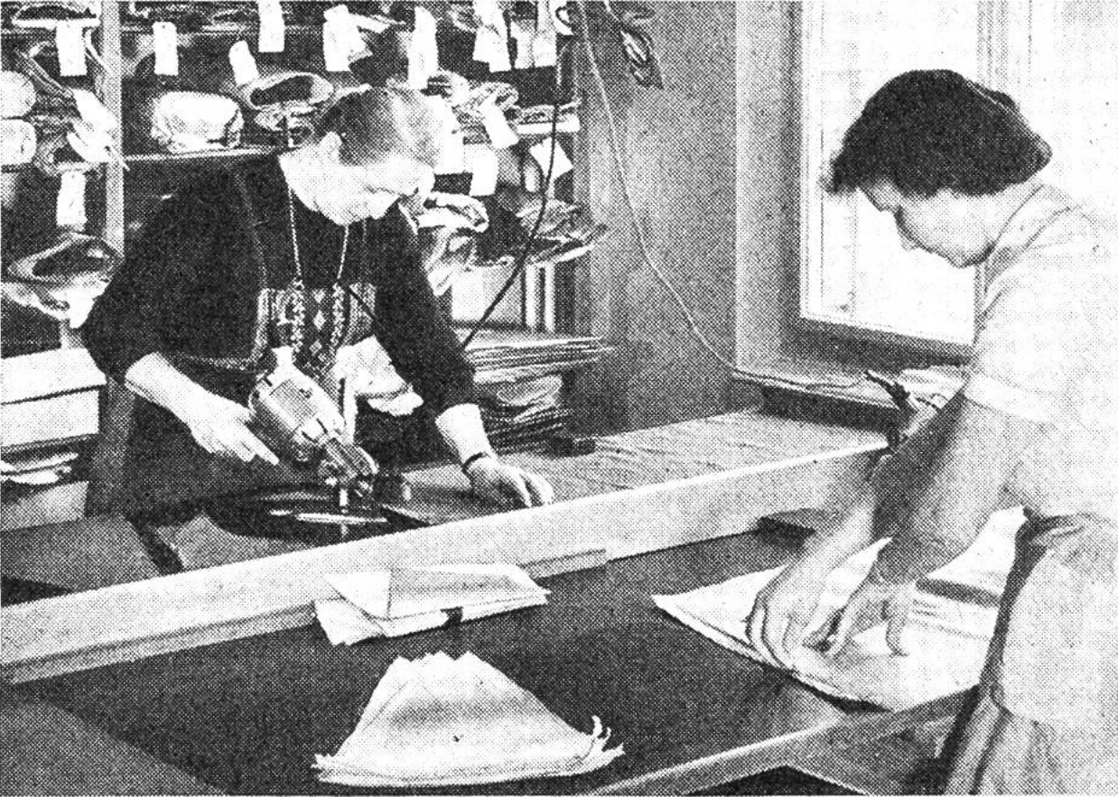
Zuschneiden der Stoffteile.

eine Metallschnur herabhing und auf dem Boden nachschleifte, um gewissermassen die «Erdung» des Blitzes zu besorgen. Ein Italiener erfand den Taschenschirm, der sich in der Mitte zusammenklappen und in ein Futteral legen liess. Die grosse Wende kam im Jahre 1852, als Fox den modernen Regenschirm schuf. An Stelle des bis dahin üblichen Fischbeingestells trat nun das