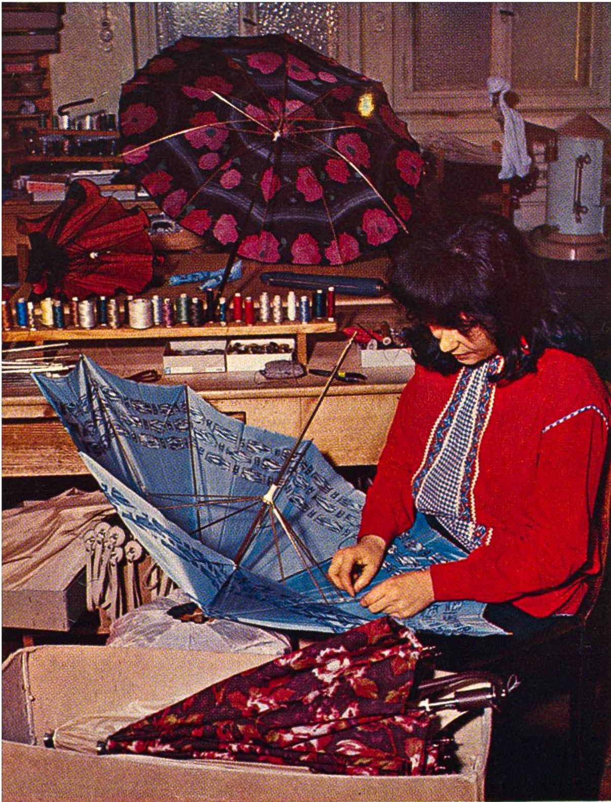
Herstellung modischer Einzelstücke in einer Schirmfabrik.