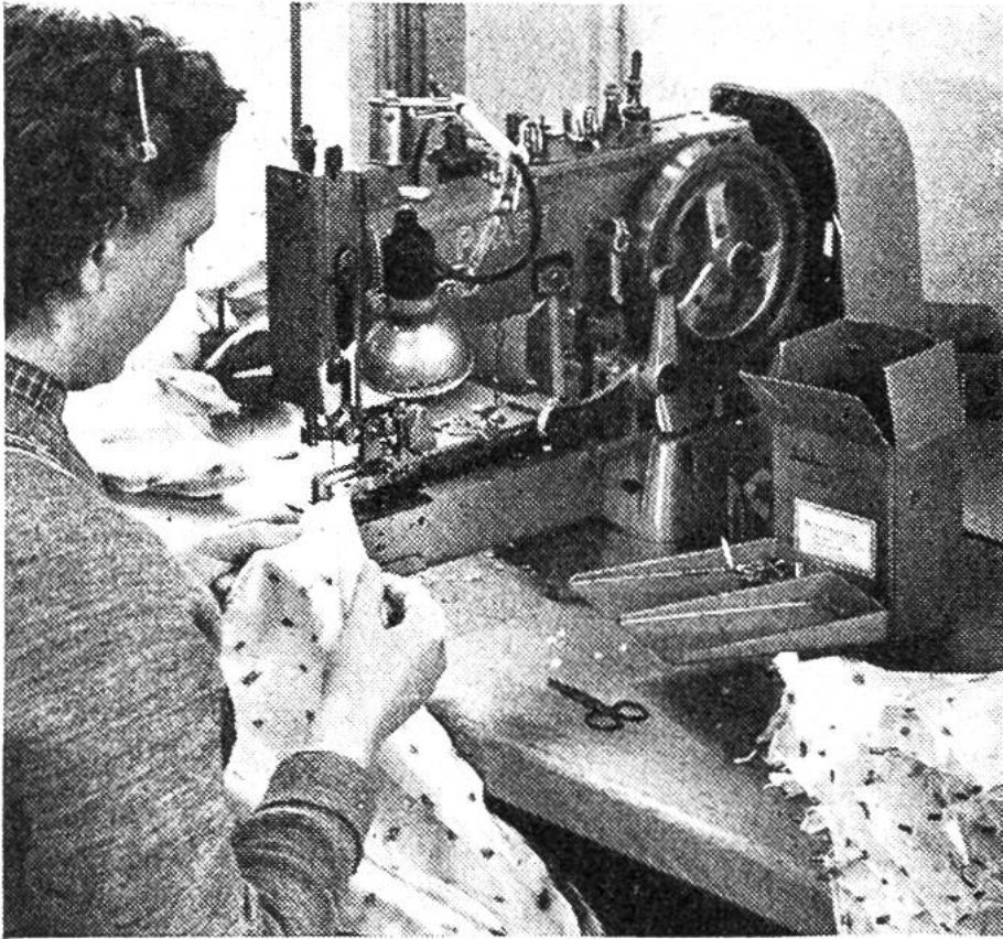
Maschinelles Annähen der Metallspitzen.

leichtere Metallgestell. Dieses wurde in der Folge immer mehr verfeinert und die Stoffe, ihre Farben und Muster der jeweiligen Mode angepasst.