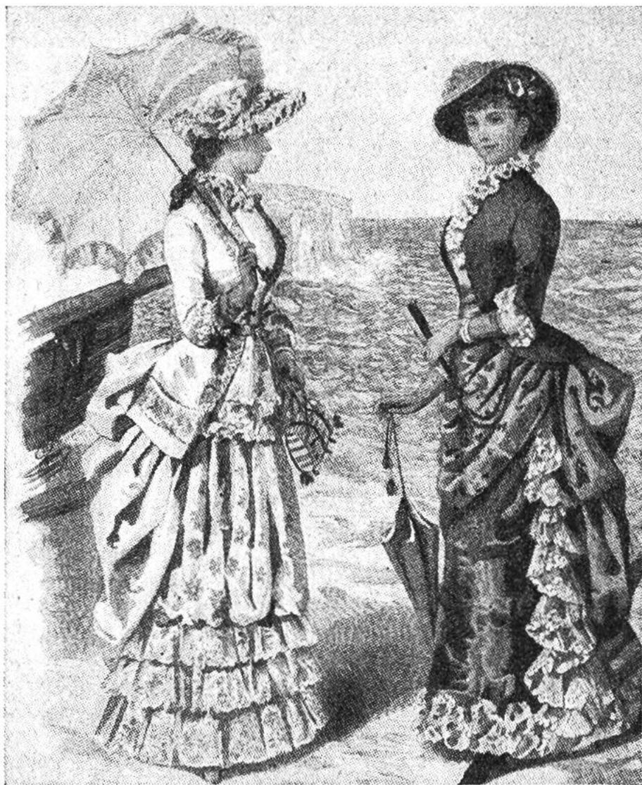
Der Sonnenschirm als modischer Schmuck. (Frankreich, 2. Hälfte des 19. Jahrh.)

stellungen ersichtlich ist. Die Damen des griechischen Altertums trugen auf dem Kopf kleine Strohschirmchen, um ihre zarte Gesichtsfarbe vor der bräunenden Sonne zu schützen.