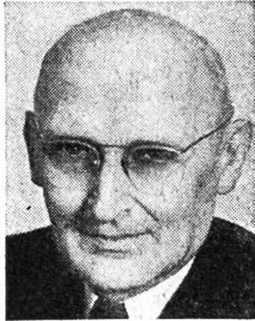
Prof. Dr. F. T. Wahlen von Trimstein-Rubigen (BE) * 1899 seit 1959 im Amt