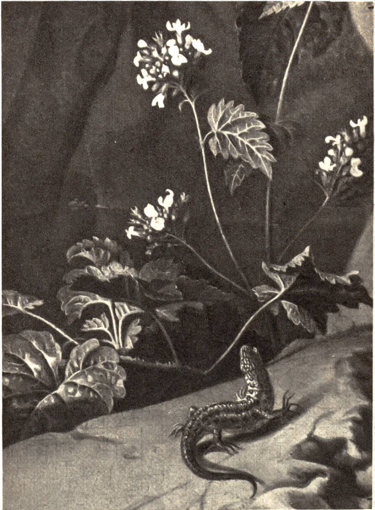
Ein Wassertümpel (Ausschnitt), von Jan Davidsz de Heem, 1606–1683, Utrecht. (Sammlung des Fürsten von Liechtenstein, Vaduz)