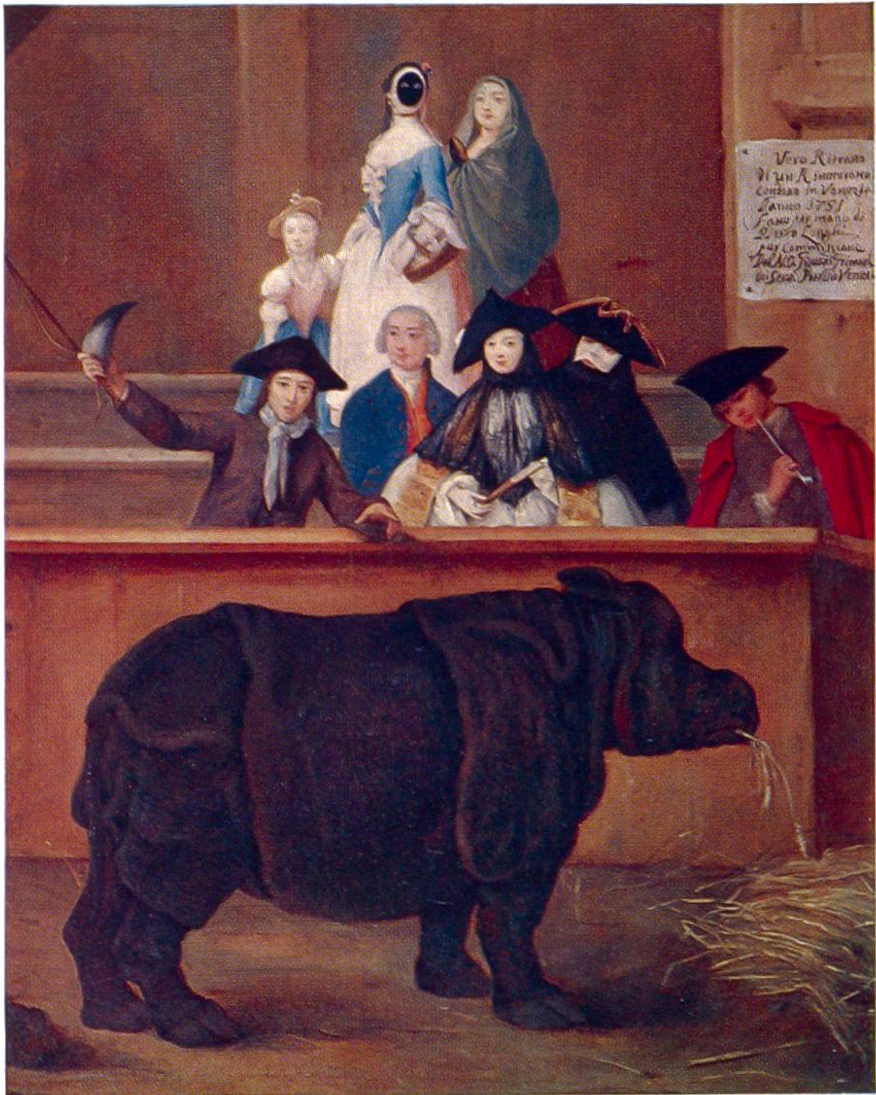
Karnevalsgesellschaft besichtigt ein Rhinoceros, von Pietro Longhi, Venedig, 1702–1785. (Nationalgalerie, London)