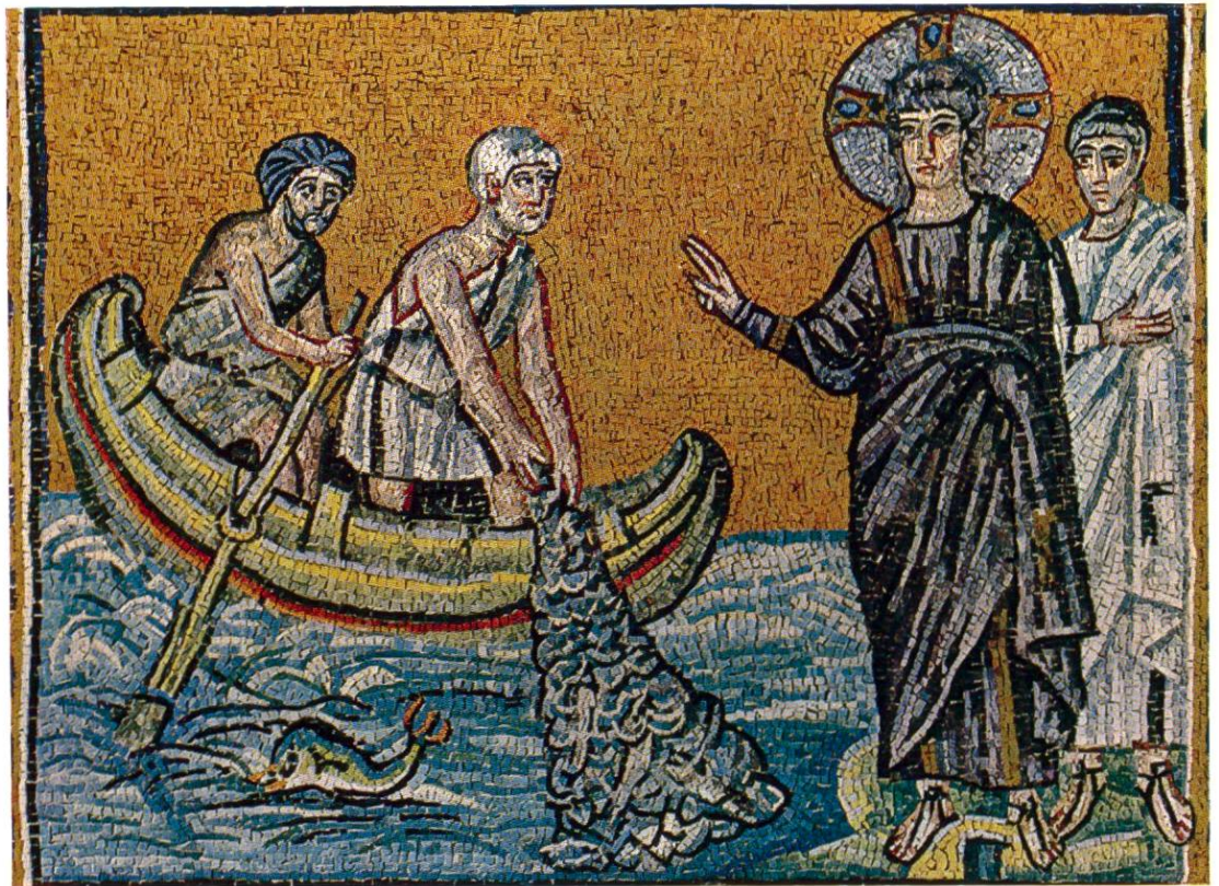
Der wunderbare Fischzug. Mosaik in der einstigen Hof- kirche des Ostgo- tenkönigs Theodo- rich, Ravenna, um 520.