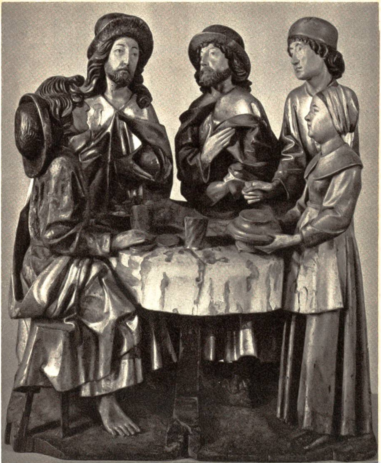
Christus in Emmaus. Deutsche Holzskulptur aus dem Anfang des 16. Jahrhunderts. (Rijksmuseum, Amsterdam)