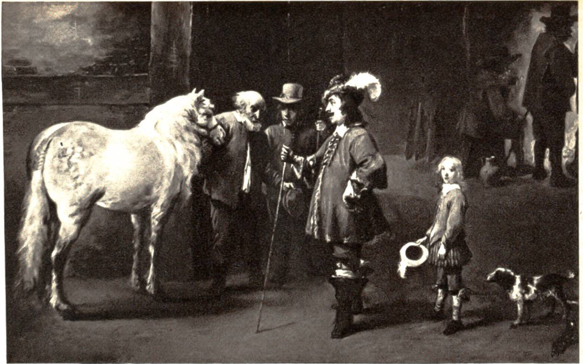
Ein Pferdehandel, von David Teniers dem Jüngeren, 1610–1690, Brüssel. (Sammlung des Fürsten von Liechtenstein, Vaduz)