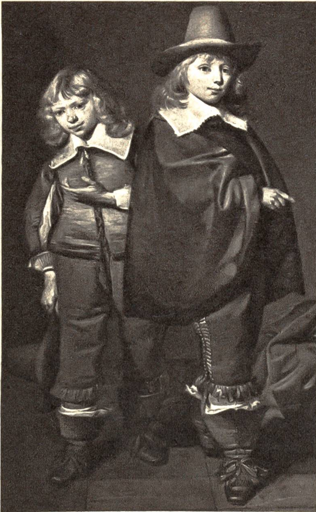
Familiengruppe (Ausschnitt) Gemälde auf Holz von Pieter Codde, 1599–1678, Amsterdam. (Rijksmuseum, Amsterdam)