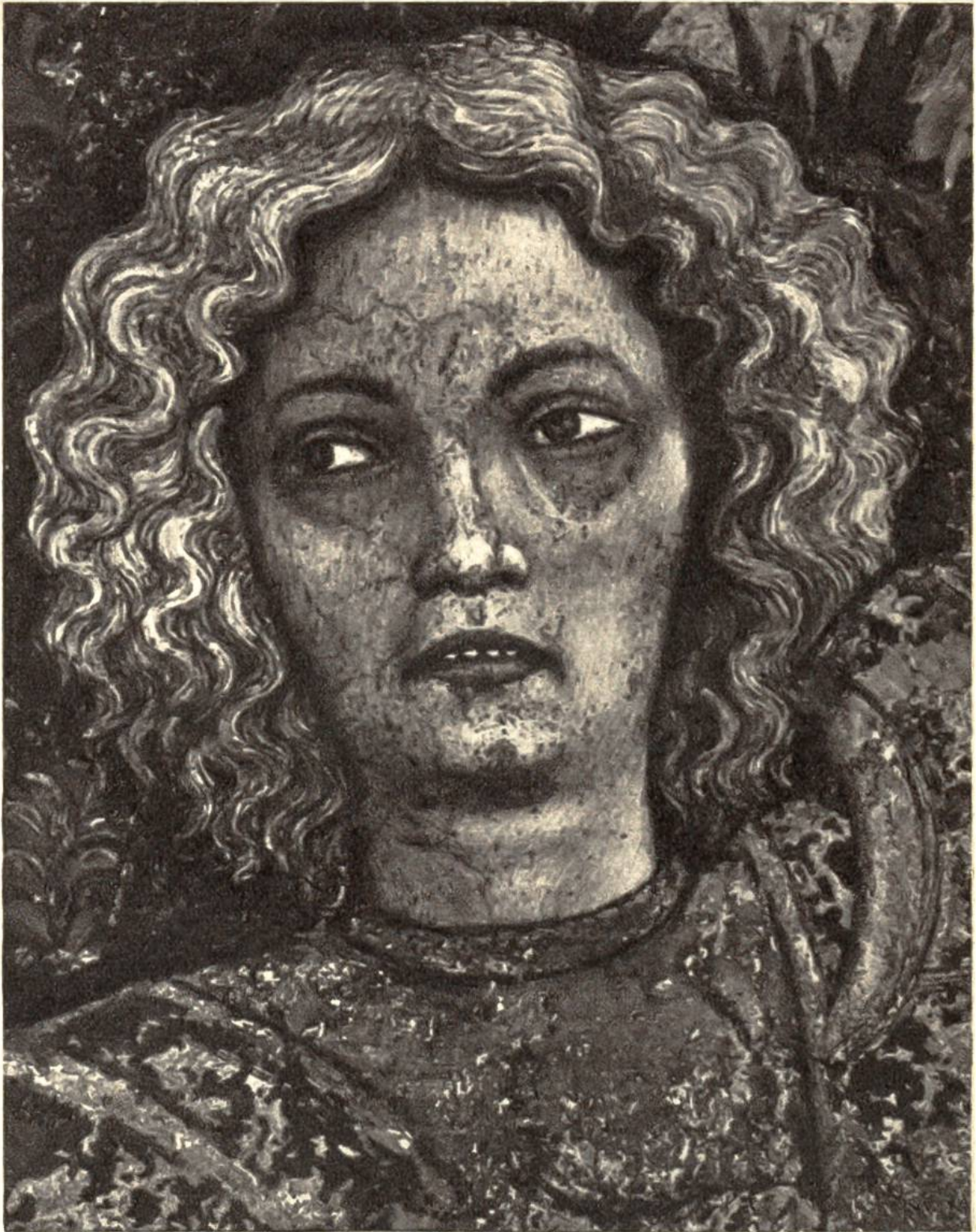
Der heilige Georg und die Fürstin (Ausschnitt), Wandgemälde von Antonio Pisano, genannt Pisanello, 1397–1450, Verona.