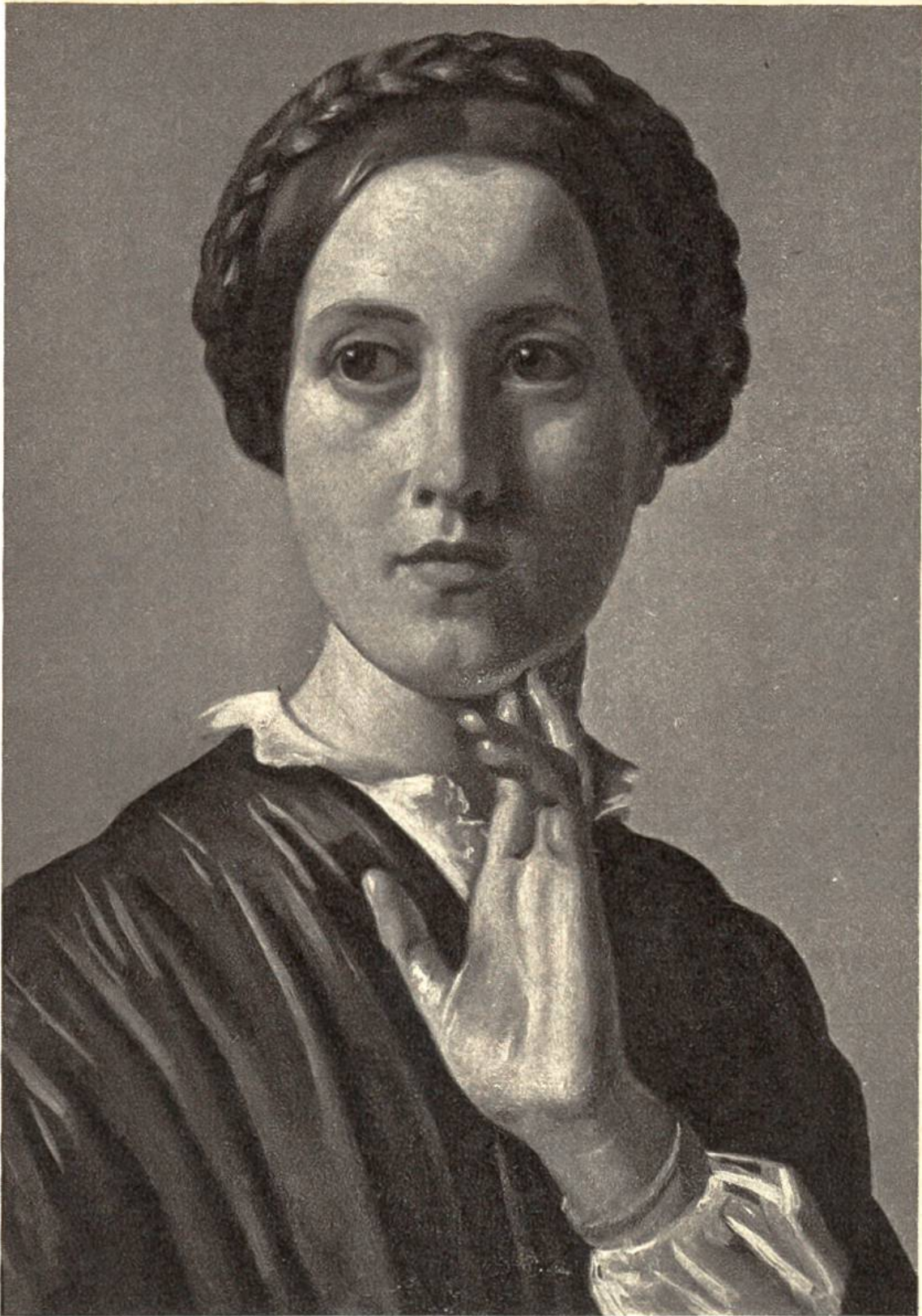
Junge Frau, von Constantin Hansen, 1804–1880, Kopenhagen. (Glyptotek, Kopenhagen)