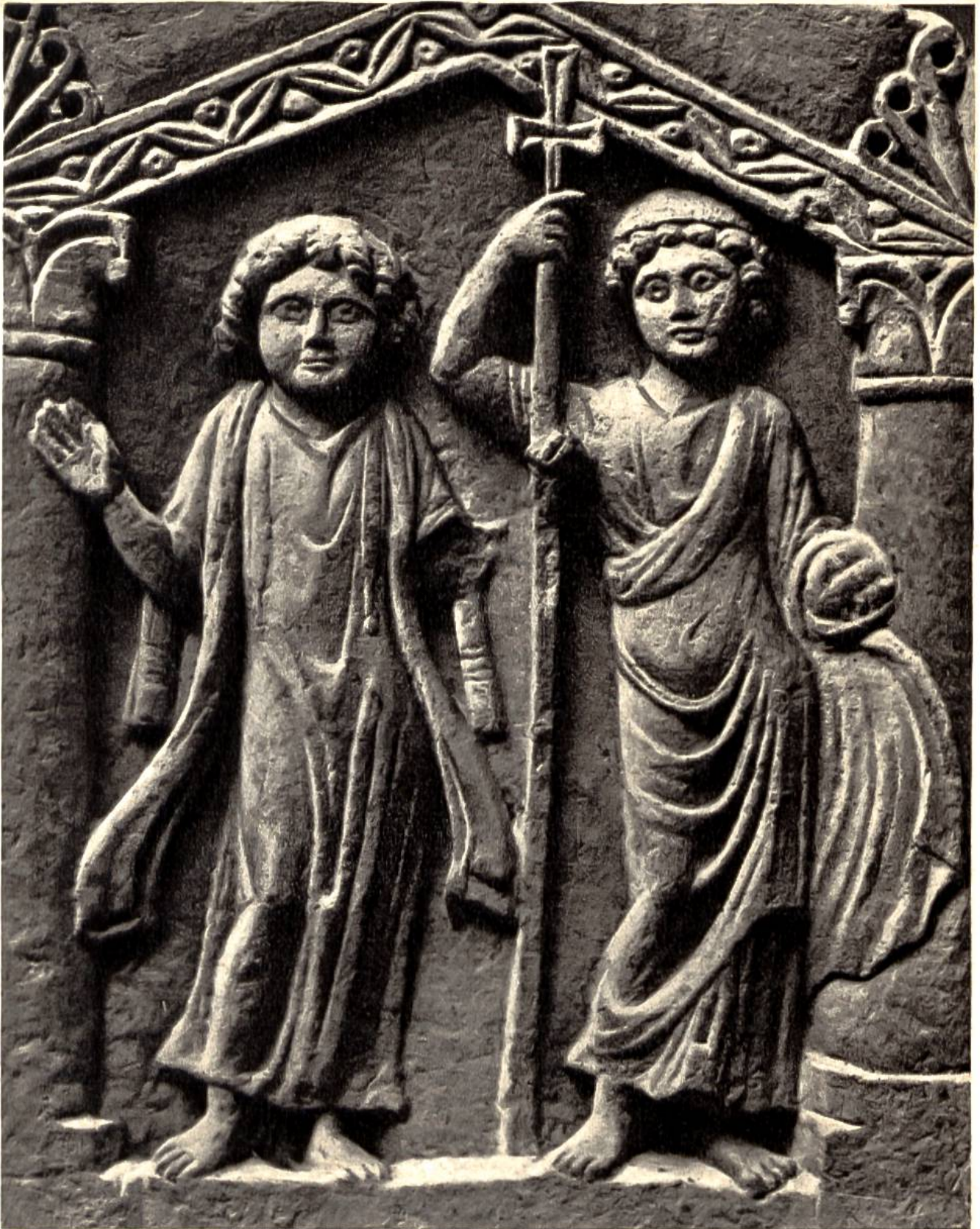
Grabstein (Stele) eines Priesters, koptische Arbeit aus Ägypten von ca. 300 n. Chr. (Glyptotek, Kopenhagen)