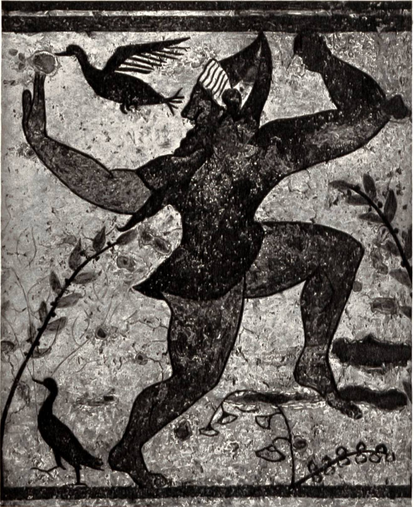
Wandmalerei in einem etruskischen Grab in Tarquinia, um 530 v. Chr.