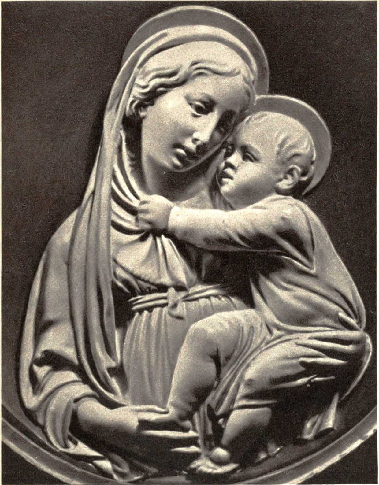
Madonna mit Kind, Majolikaskulptur (Halbrelief aus glasiertem Ton) von Luca della Robbia, 1400–1482, Florenz.