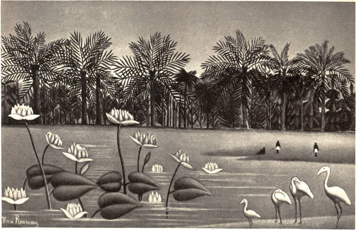
Die Flamingos, von Henri Rousseau, 1844–1910, Paris.