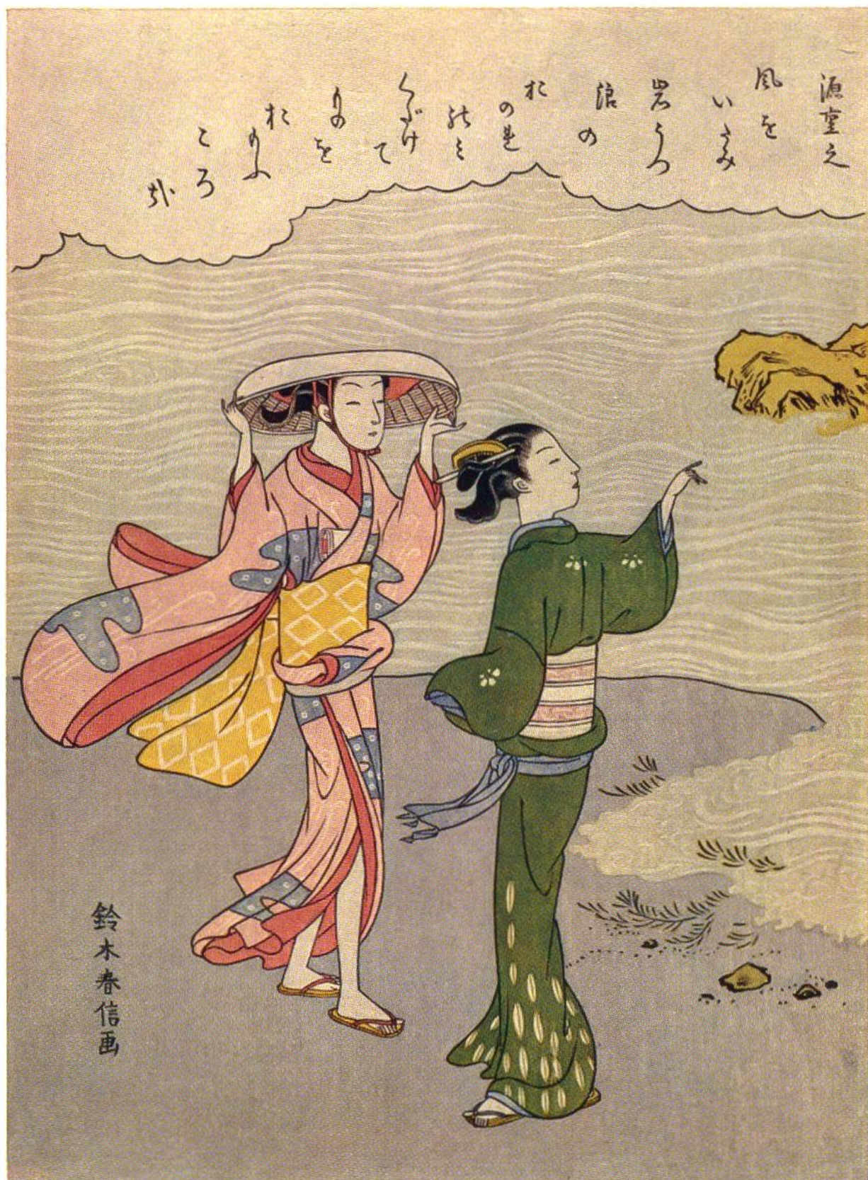
Brise am Strand. Farbenholzschnitt von Suzuki Harunobu, 1725–1770, Edo (bis 1868 Name für Tokyo).