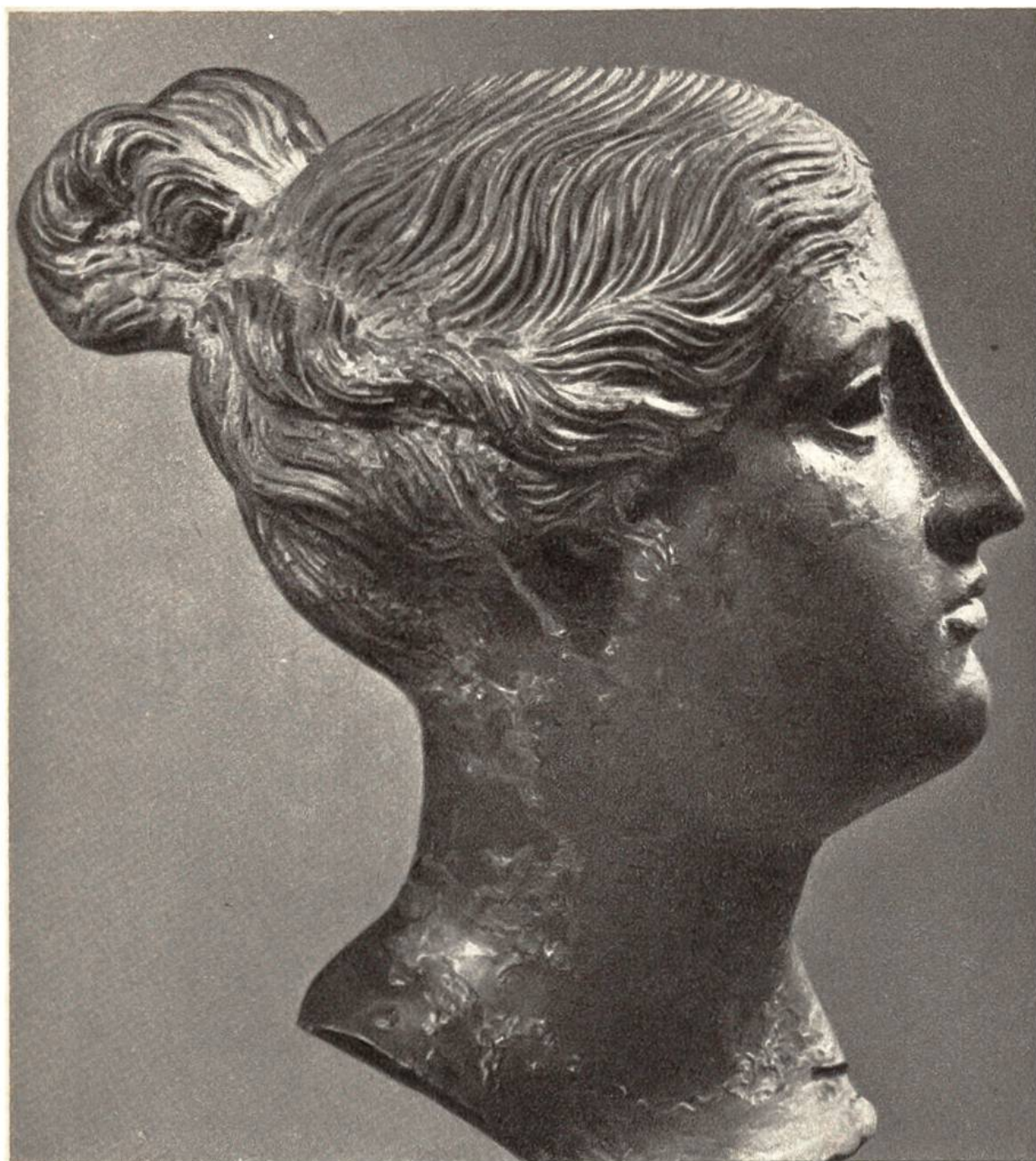
Frauenkopf, griechisch-römische Bronze aus dem 1. Jahrhundert n. Chr., 13,5 cm hoch. Gefunden 1824 in Thun-Allmendingen. (Historisches Museum, Bern)