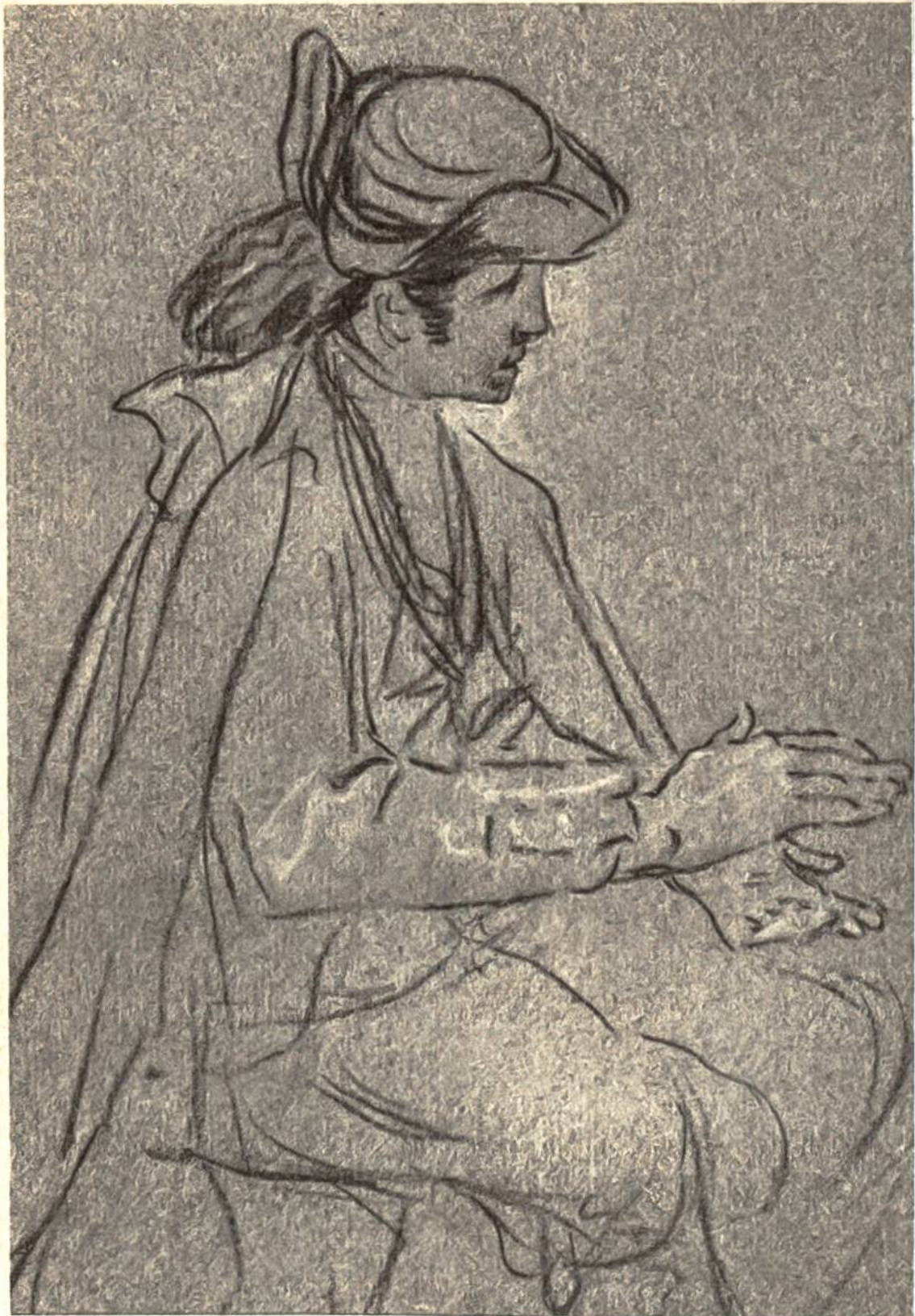
Junger Mann, Skizze von Francisco Goya, 1746–1828, Madrid. (Prado-Museum, Madrid)