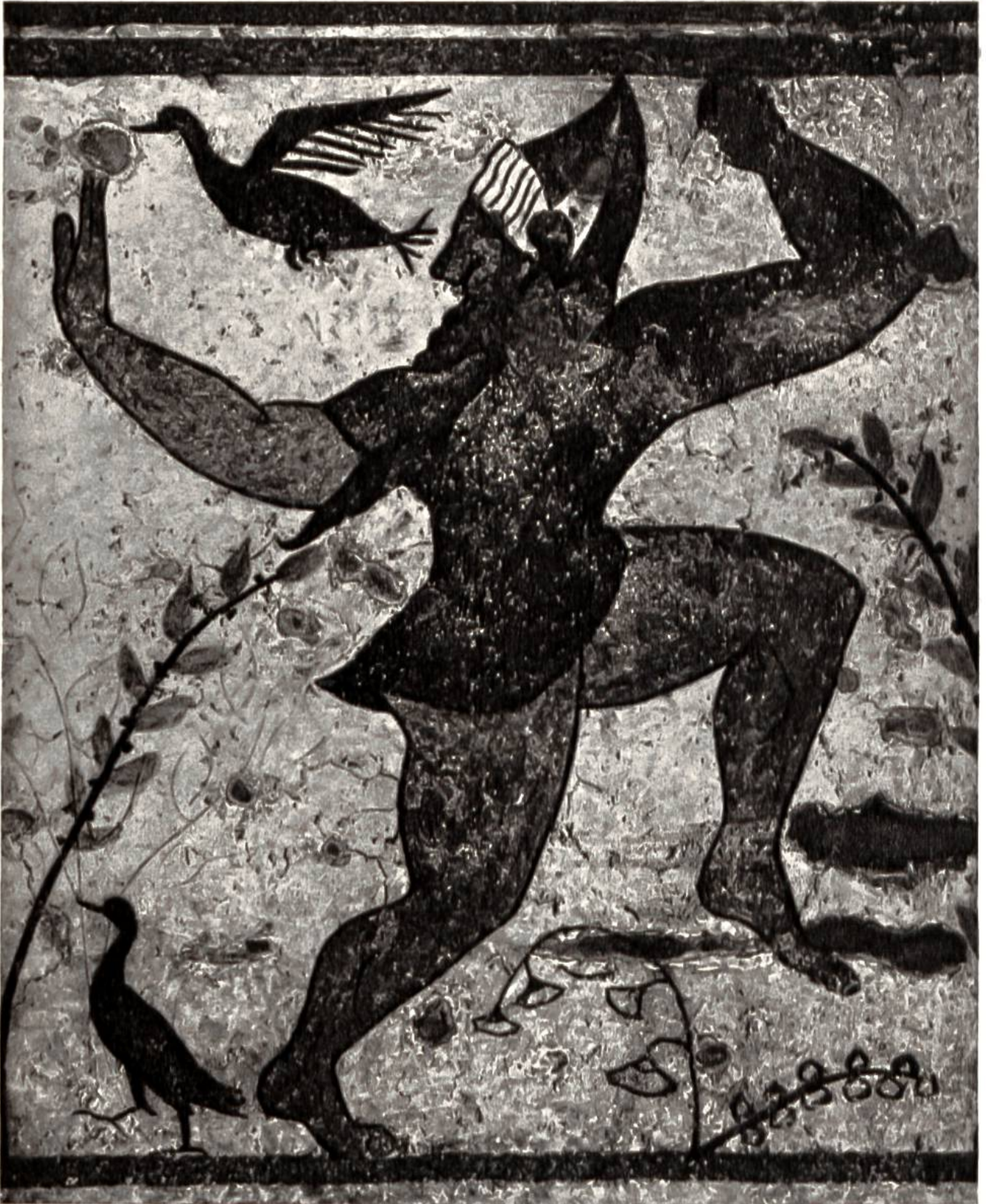
Wandmalerei in einem etruskischen Grab in Tarquinia, um 530 v. Chr.