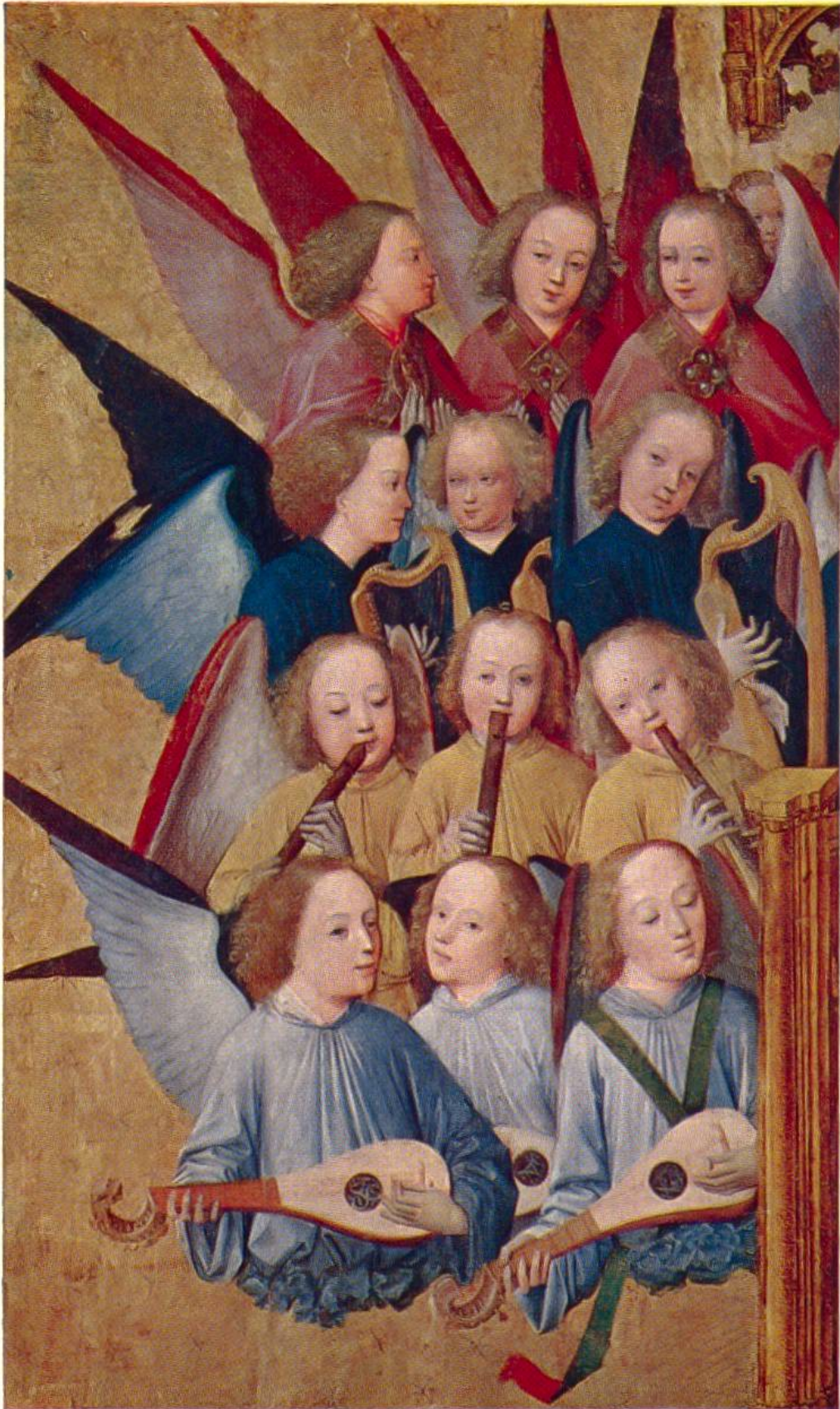
Engelchor (Teilstück) vom Meister des Marienlebens, etwa von 1460 bis 1490 in Köln tätig.