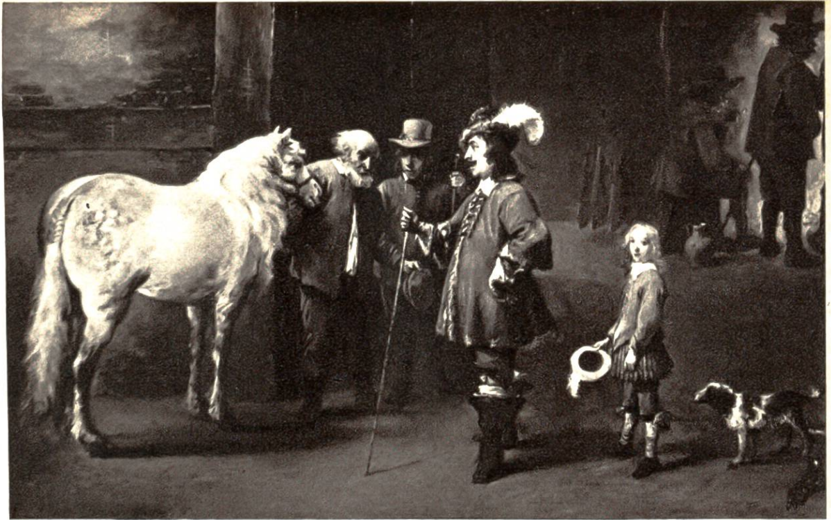
Ein Pferdehandel, von David Teniers dem Jüngeren, 1610–1690, Brüssel. (Sammlung des Fürsten von Liechtenstein, Vaduz)