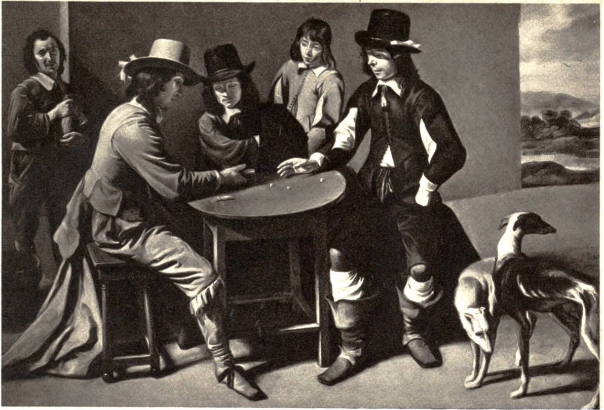
Die Würfler, von Mathieu Le Nain, 1607–1677, Paris. (Rijksmuseum, Amsterdam)