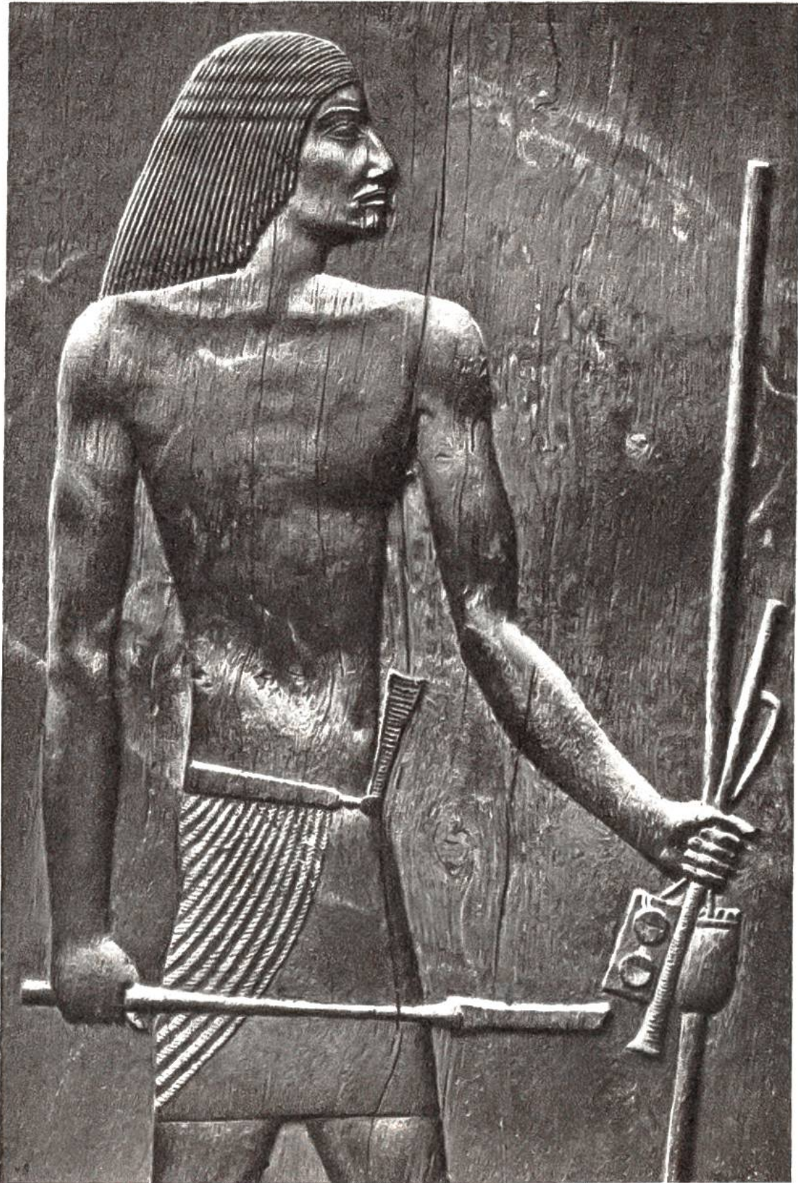
Holzbildnis des Hesirê aus seinem Grabe bei Sakkara, Ägypten, 3. Dynastie (2780–2720 v. Chr.). Hält in der linken Hand Schreibzeug, in der rechten Keulenzepter. (Ägyptisches Museum, Kairo)