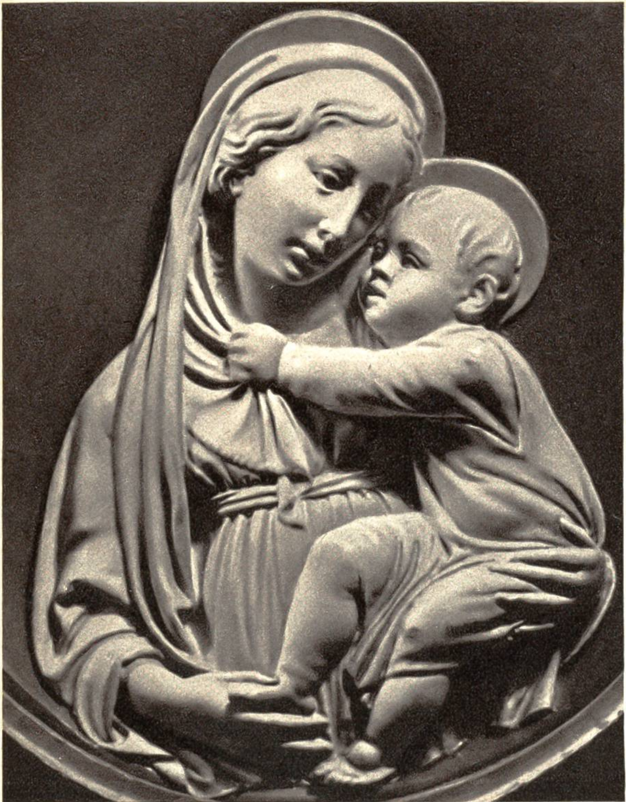
Madonna mit Kind, Majolikaskulptur (Halbrelief aus glasiertem Ton) von Luca della Robbia, 1400–1482, Florenz.