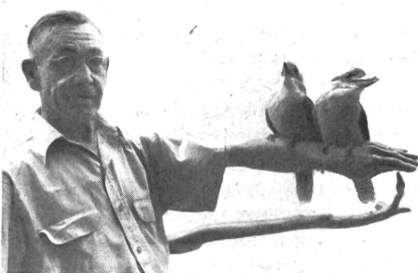
Diese zahmen «Lachenden Hänse» betrachten den Arm ihres Pflegers als einen Ast, auf den man sich setzen kann.

Auch der Mensch spielt, wie erwähnt, in der Tiergarten-Biologie eine Rolle. Schliesslich baut man ja zoologische Gärten in erster