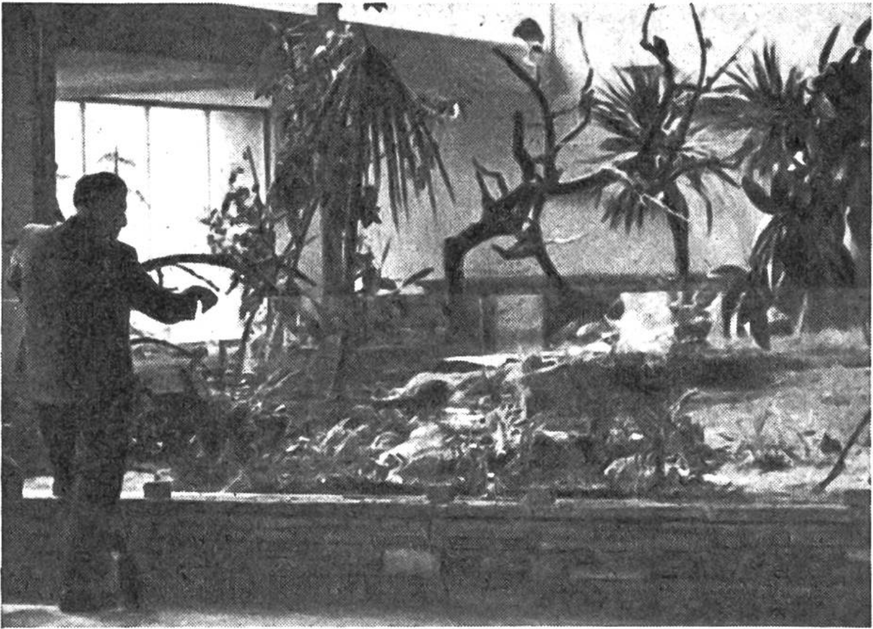
Immer mehr kommt die gruppenweise Haltung von Vögeln in offenen Flugräumen zur Anwendung (Zoo Zürich 1954).

Ersatzfutter noch nicht entdeckt; entsprechend selten sind einstweilen Zuchterfolge. Koalas, die beliebten australischen Beuteltiere, kann man nur in Ländern halten, in denen die richtigen Eukalyptusbäume wachsen, weil diese Tiere nur frische Blätter bestimmter Eukalyptus-Arten fressen. Ausserhalb Australiens gibt es daher nur in kalifornischen Zoos Koalas. Vielleicht wird es später gelingen, den entzückenden Pfleglingen die lebenswichtigen Stoffe in Tablettenform mit anderem Futter anzubieten. Aber die zweckmässige Ernährung der Tiere im Zoo ist nur eine der vielen Aufgaben der Tiergarten-Biologie. Ebenso wichtig ist zum Beispiel die zweckmässige und ansprechende Unterbringung. Während man früher die Menagerie-Tiere in eisenstangenstarreren «Zwingern» einzusperren pflegte, bemüht man sich heute, sie in möglichst natürlichen, geräumigen, hübsch umpflanzten Anlagen zu halten, in Naturausschnitten, die alles für das Tier Wesentliche enthalten, mit Schwimm-, Kletter-, Grab- oder Lauf-