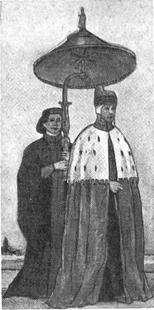
Venezianischer Doge, dem als Zeichen der Macht ein prunkvoller Schirm nachgetragen wird (um 1500).