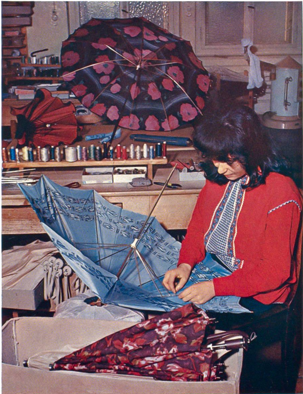
Herstellung modischer Einzelstücke in einer Schirmfabrik.