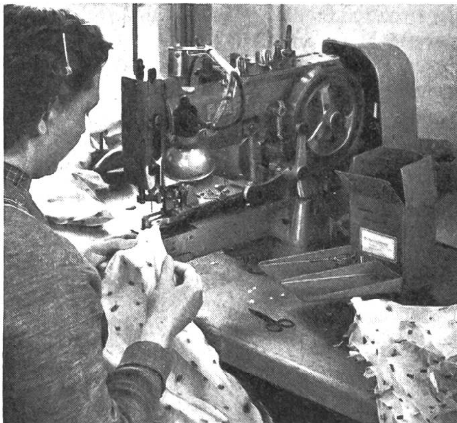
Maschinelles Annähen der Metallspitzen.

leichtere Metallgestell. Dieses wurde in der Folge immer mehr verfeinert und die Stoffe, ihre Farben und Muster der jeweiligen Mode angepasst.