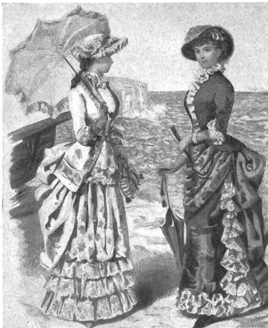
Der Sonnenschirm als modischer Schmuck. (Frankreich, 2. Hälfte des 19. Jahrh.)

stellungen ersichtlich ist. Die Damen des griechischen Altertums trugen auf dem Kopf kleine Strohschirmchen, um ihre zarte Gesichtsfarbe vor der bräunenden Sonne zu schützen.