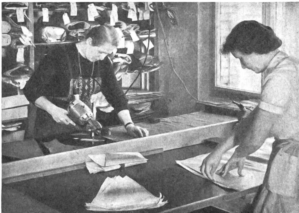
Zuschneiden der Stoffteile.

eine Metallschnur herabhing und auf dem Boden nachschleifte, um gewissermassen die «Erdung» des Blitzes zu besorgen. Ein Italiener erfand den Taschenschirm, der sich in der Mitte zusammenklappen und in ein Futteral legen liess. Die grosse Wende kam im Jahre 1852, als Fox den modernen Regenschirm schuf. An Stelle des bis dahin üblichen Fischbeingestells trat nun das