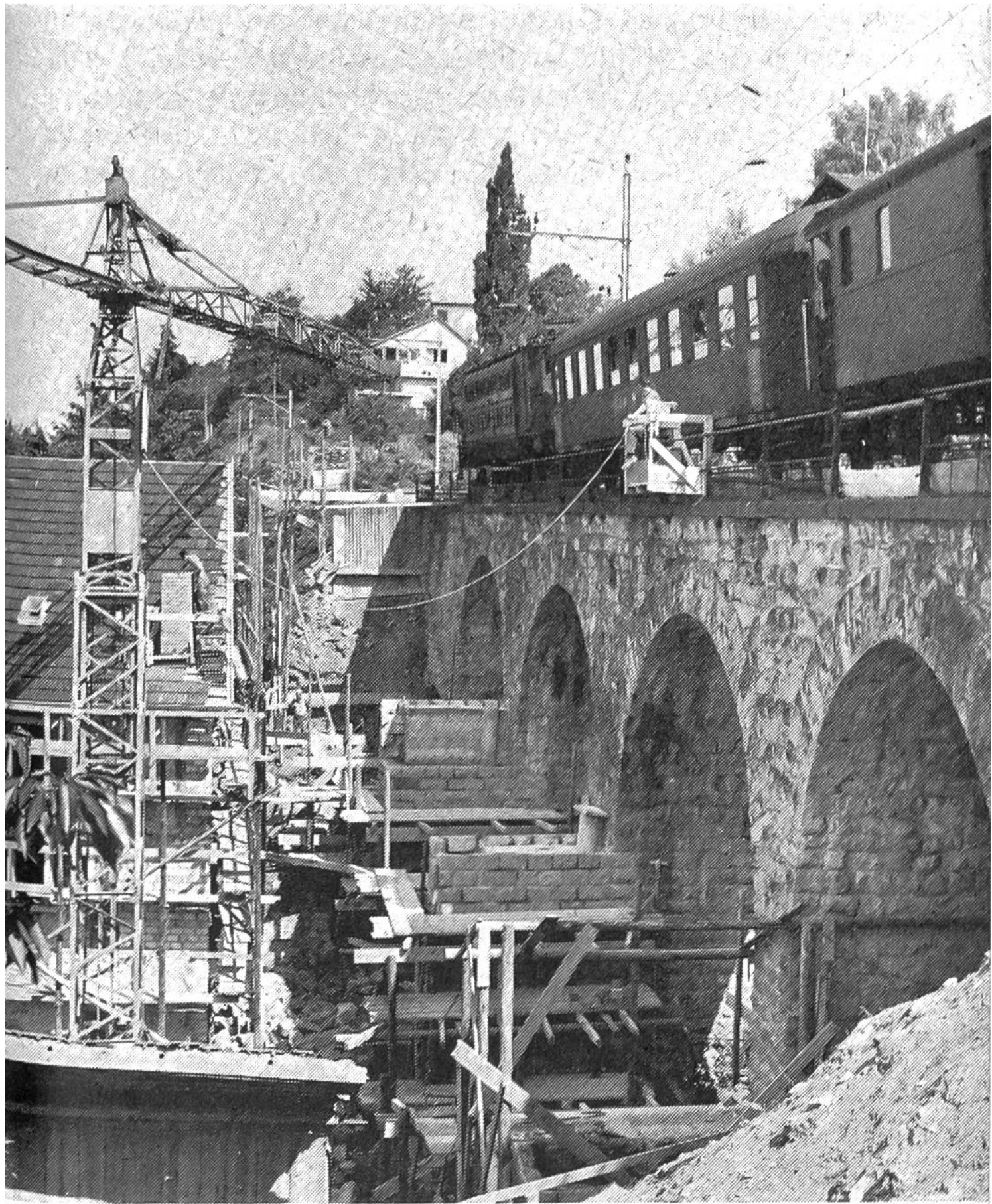
Verbreiterung des Viaduktes «Pfarrgasse» an der Strecke Erlenbach-Herrliberg/Feldmeilen.