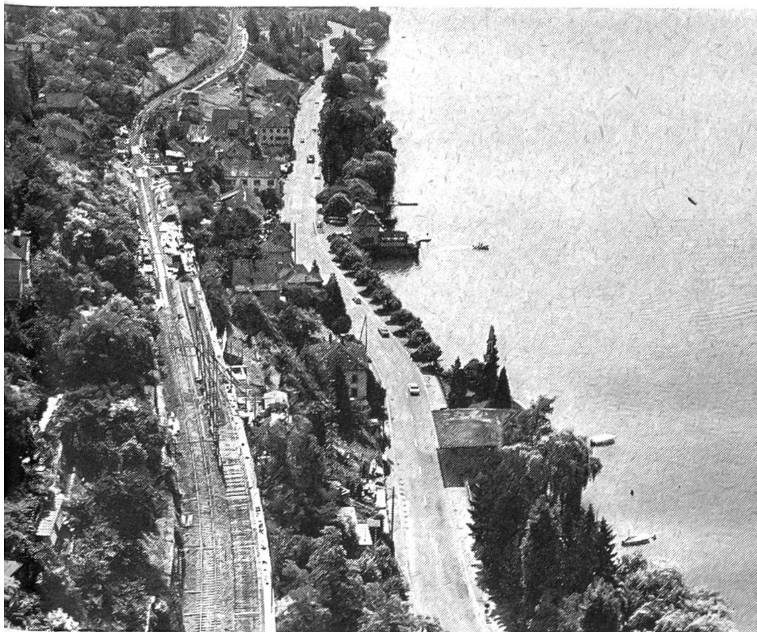
Zwischen Erlenbach und Herrliberg/Feldmeilen, an der Seehalde, wird ein Lehnenviadukt gebaut, damit ein zweites Geleise gelegt werden kann.