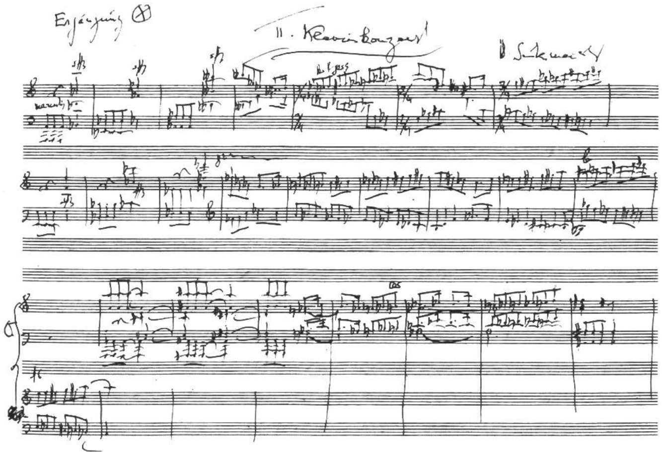
Partiturbblatt aus dem II. Klavierkonzert von Heinrich Sutermeister.

lichstes enthüllt erst seine Musik. Interessant wird der Musiker aber erst dann, wenn wir ihn von seinem Werke her betrachten. Wir haben in der Schweiz einen der hervorragendsten Musikdramatiker unserer Zeit, einen Opernkomponisten, der den sicheren Instinkt für die Bühne hat und in dessen Adern Theaterblut fliesst. Er heisst Heinrich Sutermeister.