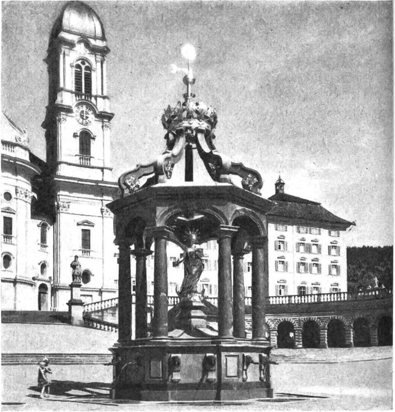
Liebfrauenbrunnen in Einsiedeln von 1686

Maria auf den Brunnen, um seine Verehrung für die Muttergottes zu bezeugen. So steht die Maria im Liebfrauenbrunnen vor der Stiftskirche von Einsiedeln (Abb. 2) von 1686 auf einem kleinen Podest inmitten von Säulen wie in einer offenen Loggia. Durch 14 Wasserspeier fließt das Wasser in einen flachen Trog. Der ganze Brunnen ist hier wie ein richtiger Bau angelegt und zeigt, wie der Barockstil auch ein einfaches Werklein als Gesamtkunstwerk errichtet.