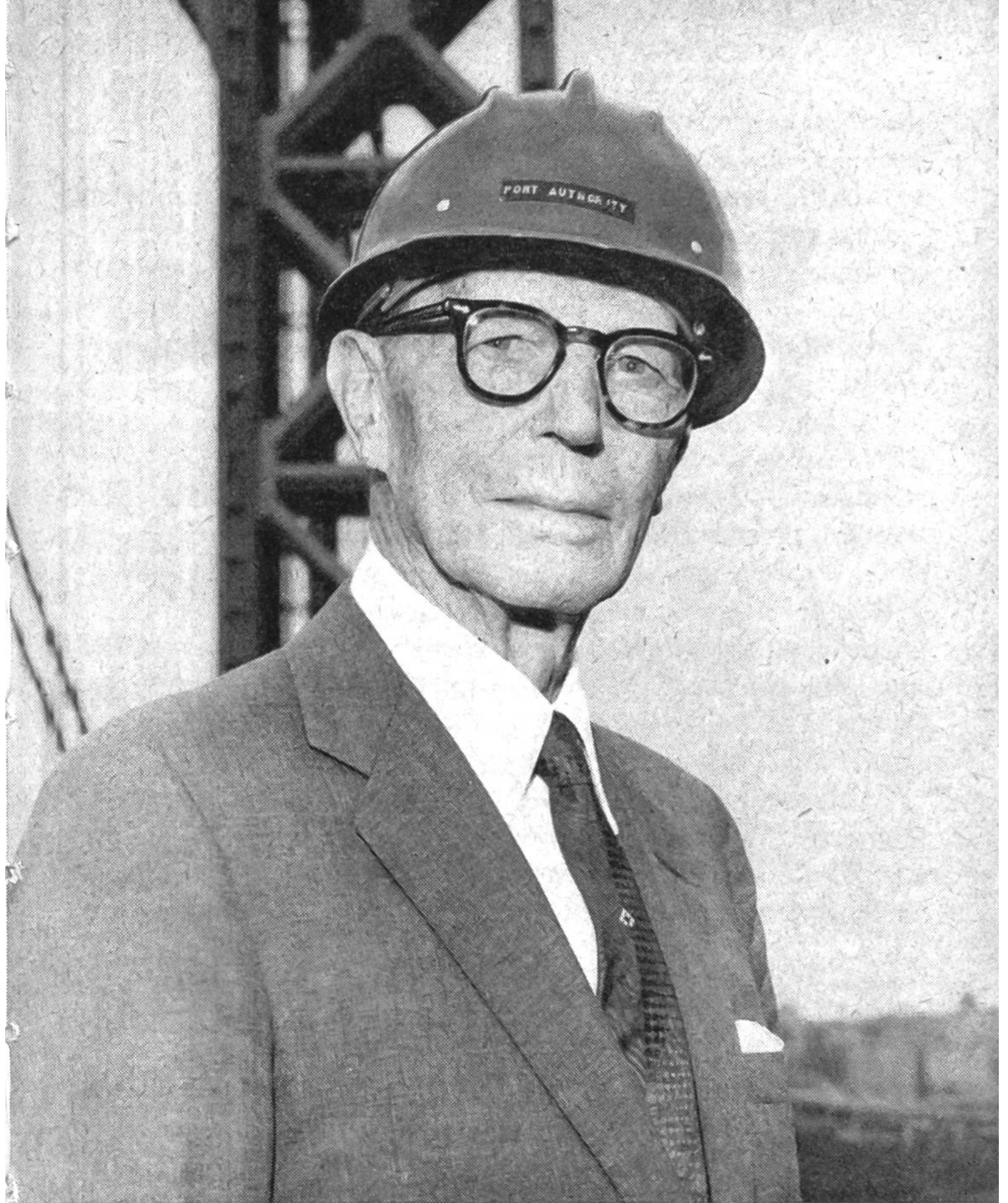
Othmar H. Ammann, der bedeutendste Brückenbauer der Welt, hat mit 85 Jahren sein Meisterwerk geschaffen, das als achttes Weltwunder bezeichnet wird: Die Verrazano-Narrows Bridge, die grösste Hängebrücke der Welt.