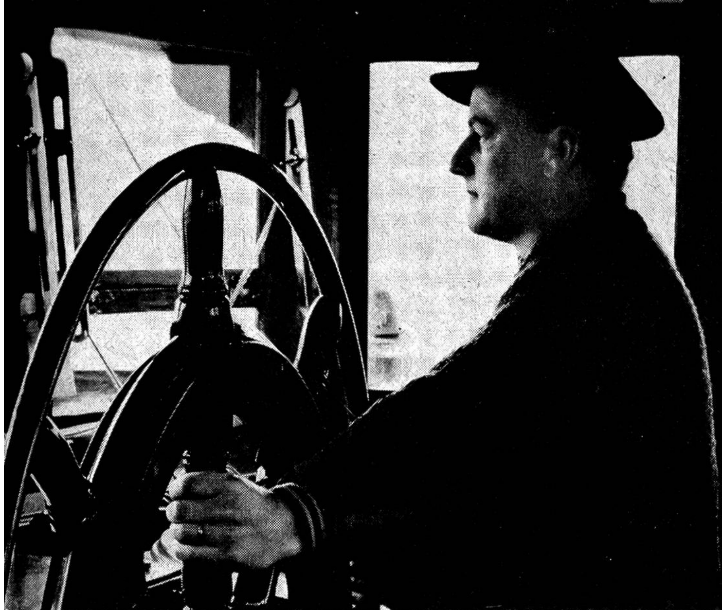
Schweizerischer Rheinschiffsführer am Steuerstuhl.

dass die Wasserstrasse nicht nur die leistungsfähigste, sondern auch die billigste Transportmöglichkeit bietet.