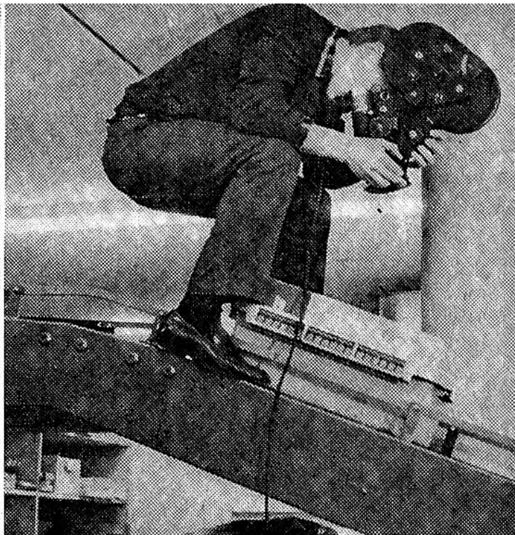
Bild und Ton werden synchron aufgenommen. Oben auf der Kamera ist eine 120-Meter-Kassette montiert. 12 Minuten können damit gefilmt werden.