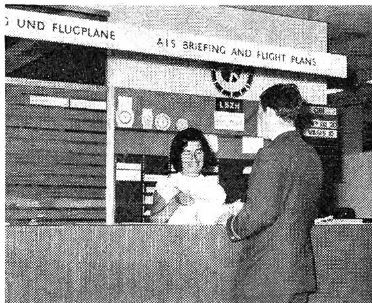
Im Fluginformationsbüro wird der Flugplan kontrolliert.

Die Häuser unter uns werden zu Spielzeugen, die Landschaft wird zum Kartenbild. Die Täler liegen im blauen Dunst; der Tödi und die Spitzen der Berner Alpen glänzen in der Morgensonne. Welch herrlicher Ausblick, und dazu ein reichliches Frühstück, serviert von freundlichen Hostessen. 8.23 Uhr, Höhe 7400 Meter, Position Monte Ceneri. Die Funkverbindung wechselt von Zürich nach Mailand; nun steht die DC-9 unter italienischer Flugkontrolle.