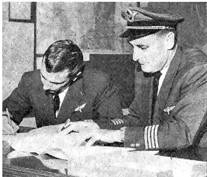
Die Piloten legen den genauen Flugplan fest.