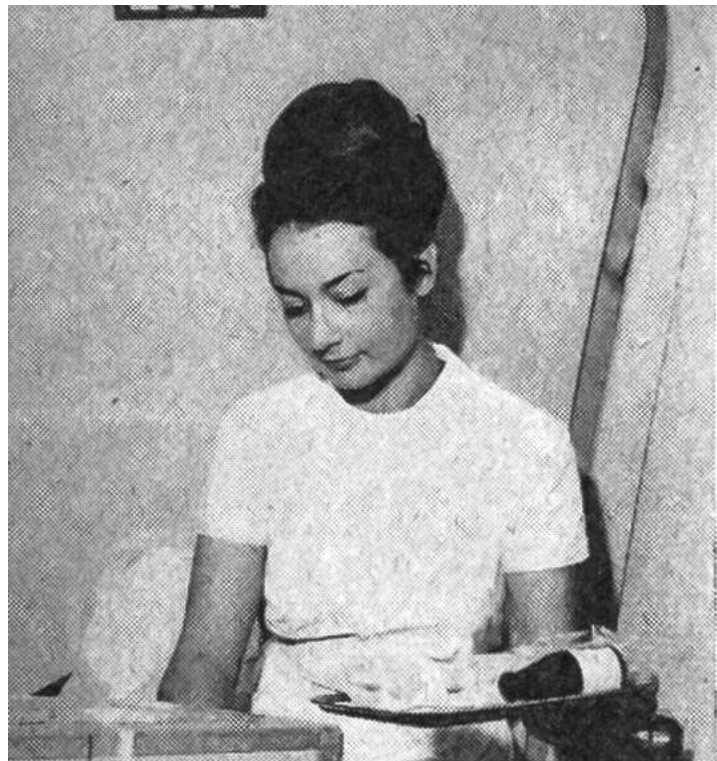
Servicevorbereitung an Bord.