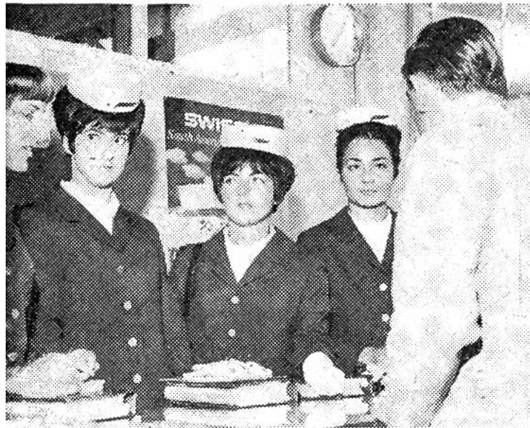
Vor dem Abflug werden die Fachkenntnisse der Airhostessen durch Stichfragen geprüft.