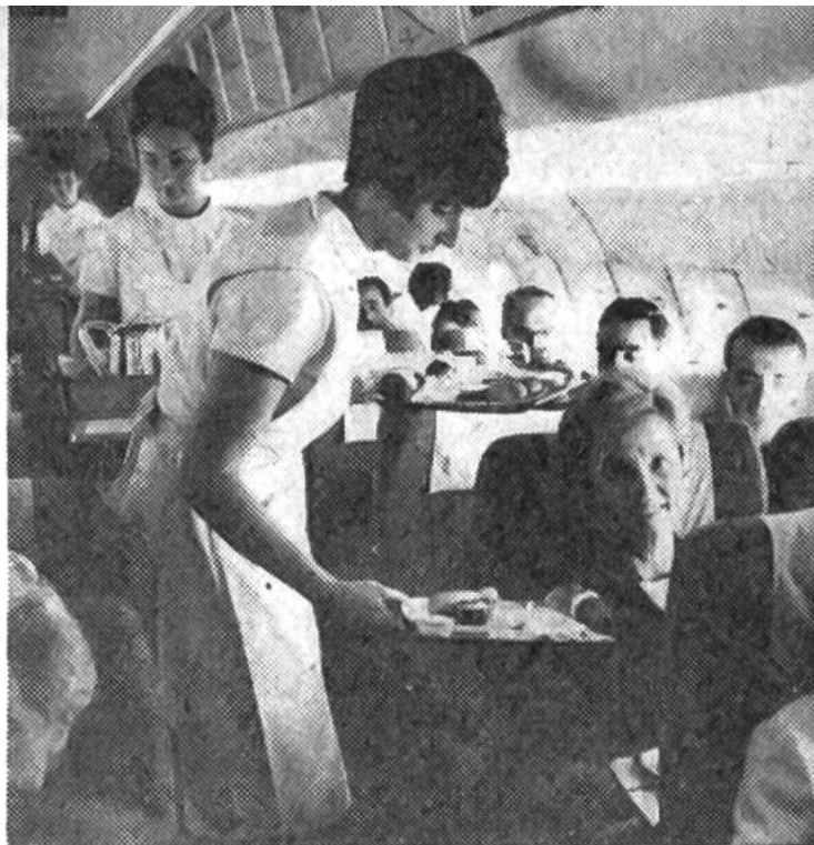
Frühstück auf 8800 Metern über Meer, serviert von freundlichen Hostessen.

weisung, auf 4500 Meter abzusinken – wir hören ihre Funkgespräche mit dem Römer Kontrollturm sehr gut. Um 8.53 Uhr erhält unsere Besatzung die Bewilligung, auf 7000 Meter hinunter zu wechseln. 9.00 Uhr, ein leichtes Schütteln – das Fahrwerk wird ausgefahren – Kapitän und Co-Pilot durchgehen eine lange Liste mannigfacher Kontrollen. 55 Kilometer vor uns im Dunst liegt der Flughafen Rom-Fiumicino. Und wieder Rom: «Swissair 600; Sie können als Nr.2 in Rom landen, gleich hinter der TWA.» Über das Bordmikrofon werden die Passagiere gebeten, nicht mehr zu rauchen und sich wieder anzuschnallen. Noch 14 Kilometer bis Fiumicino – die TWA setzt mittlerweile zur Landung an –, wir fliegen immer tiefer.