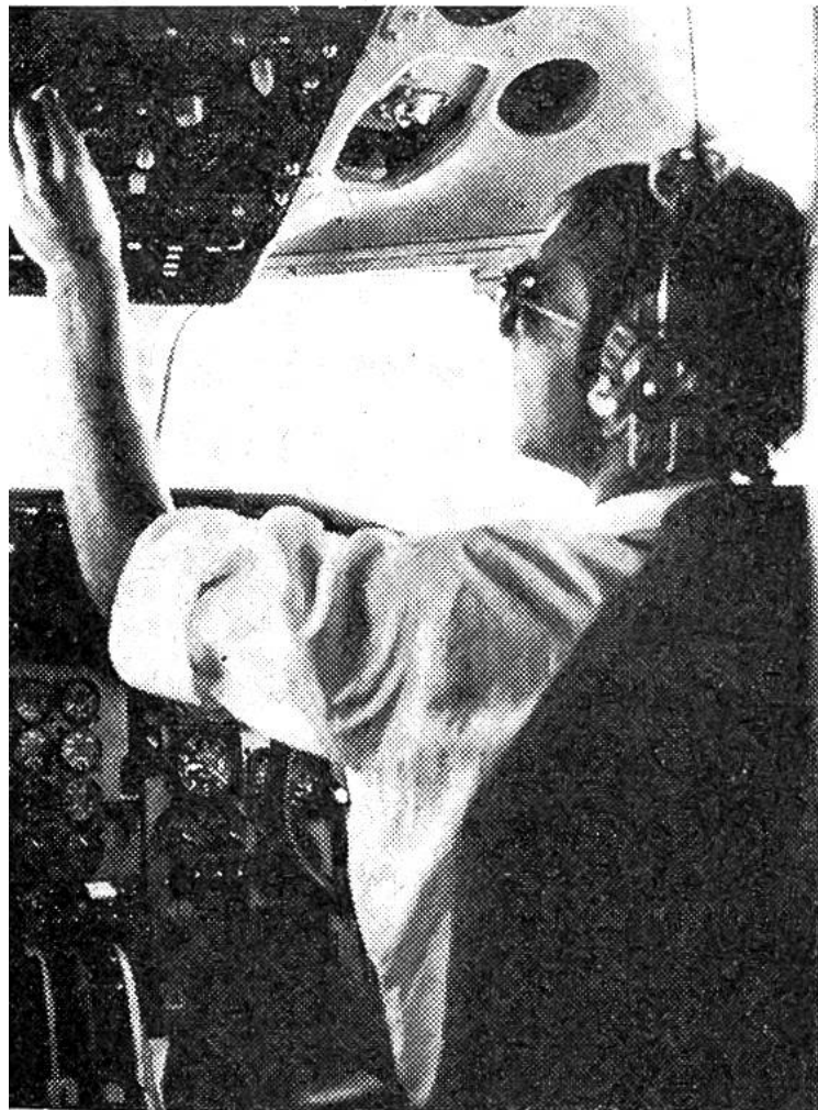
Der Co-Pilot auf dem rechten Sitz überprüft Schalter, Uhren, Messanzeiger.