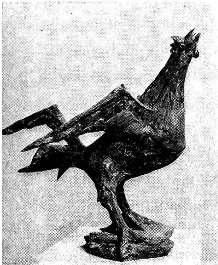
Hahn, Bronze, 1957.