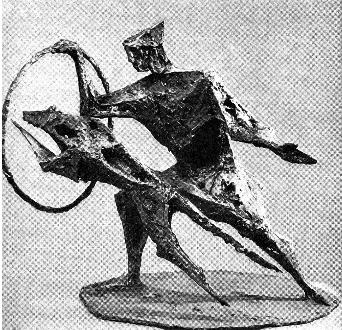
Akrobat mit Hund, Bronze, 1965.

genau aussehen; Pferd und Figuren sind nur Anlass, Ausgangspunkt für eine bestimmte Vorstellung des Bildhauers.