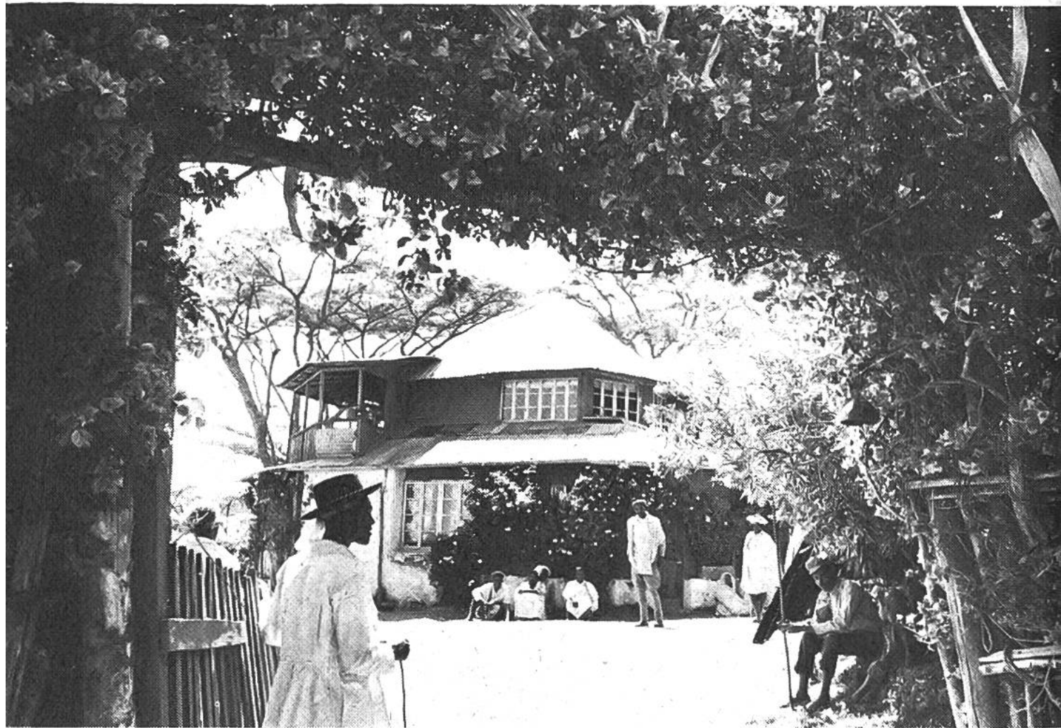
Patienten und Rekonvaleszenten vor dem Urwaldspital.

der äthiopischen Regierung unter Kaiser Haile Selassie die Erlaubnis, wie eine Ärztin zu praktizieren. Das gibt es nicht in unserem Land. Höchstens im Kanton Appenzell, wo sich allerart Wunderdoktoren, Kurpfuscher und Quacksalber angesiedelt haben. Als Arzt braucht es ein langes Studium, aber zuvor die Maturität. In unterentwickelten Ländern, in Gebieten der Not, im Lande der Pioniere, zu Kriegszeiten mag das anders sein. Wer wäre bei Bedarf zur Stelle? Das Naturtalent. Ihm eröffnet sich eine Chance. Der Mutige riskiert etwas. Er packt zu und hilft. Er vertraut dem gesunden Menschenverstand. Er handelt aus Gesehenem und Gelesenem. Er handelt aus der gesammelten Erfahrung, aus soundsoviel Gelungenem und Misslungenem. Er ist ein Autodidakt. Er hat sich aus eigener Kraft und Anschauung emporgearbeitet. Entweder setzt er sich durch und