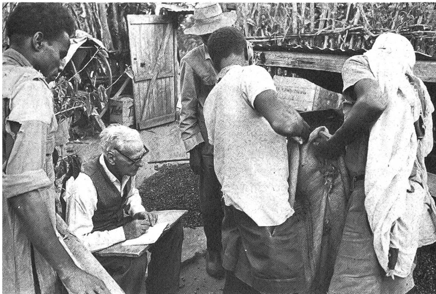
Buchführung bei der Kaffeeernte.

hat Erfolg. Oder er fällt und geht unter. Geht es um Sachen, ist es weiter nicht tragisch. Er macht Konkurs. Steht aber Menschenleben auf dem Spiel, da lauert das Delikt der fahrlässigen Tötung.