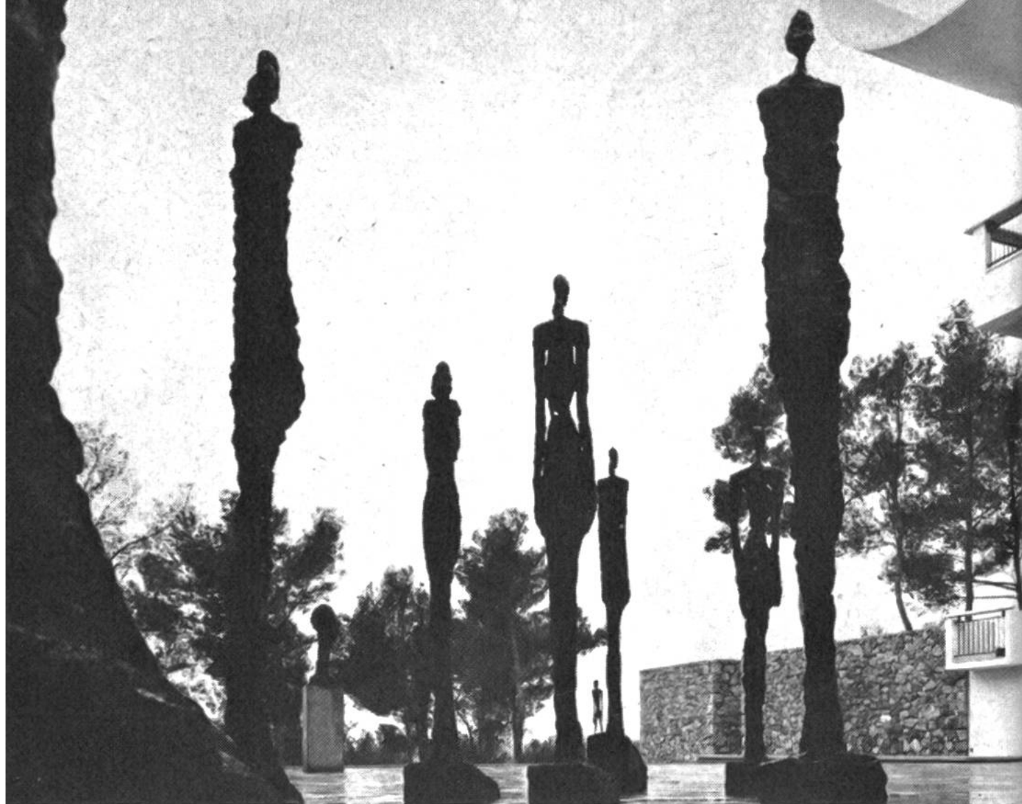
Alberto Giacometti (1901–1966), Menschenfiguren, Bronze. Fondation Maeght, Saint-Paul-de-Vence.

Abbildung zeigt eine Gruppe von überlangen, in ihrem Volumen wie geschrumpften Figuren. Die Figur steht nicht mehr wie früher im Raum, sondern der Raum verdrängt die Figur, die nun jede Persönlichkeit verloren hat. Selbst in den Bildnissen wirkt der Mensch bei Giacometti anonym, wie von der ihn belastenden Materie des Körpers befreit und damit vergeistigt. Die Realität ist aufgehoben und durch ein Netz von seelischen Beziehungen ersetzt.