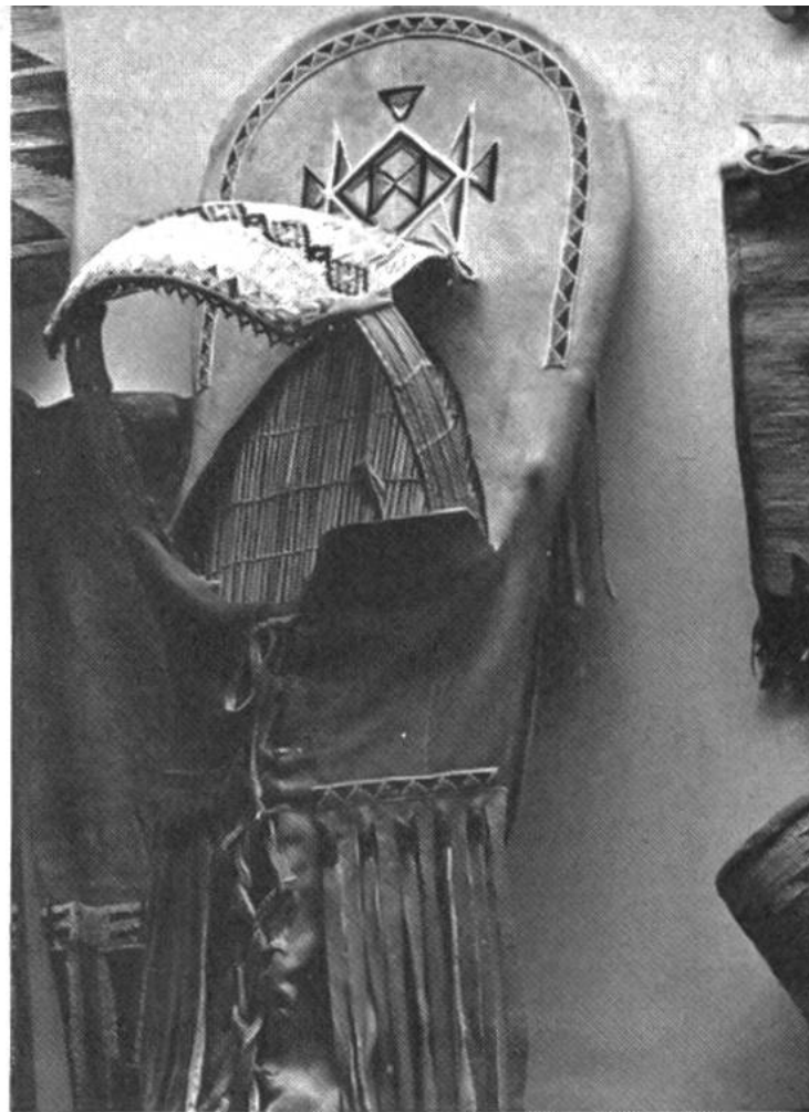
Kindertragsache, Das Kind wurde wie auf einem Räf auf dem Rücken der Mutter mitgetragen.