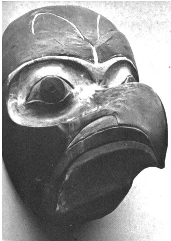
Tanzmaske der Haida-Indianer, Queen-Charlotte-Insel (Kanada).