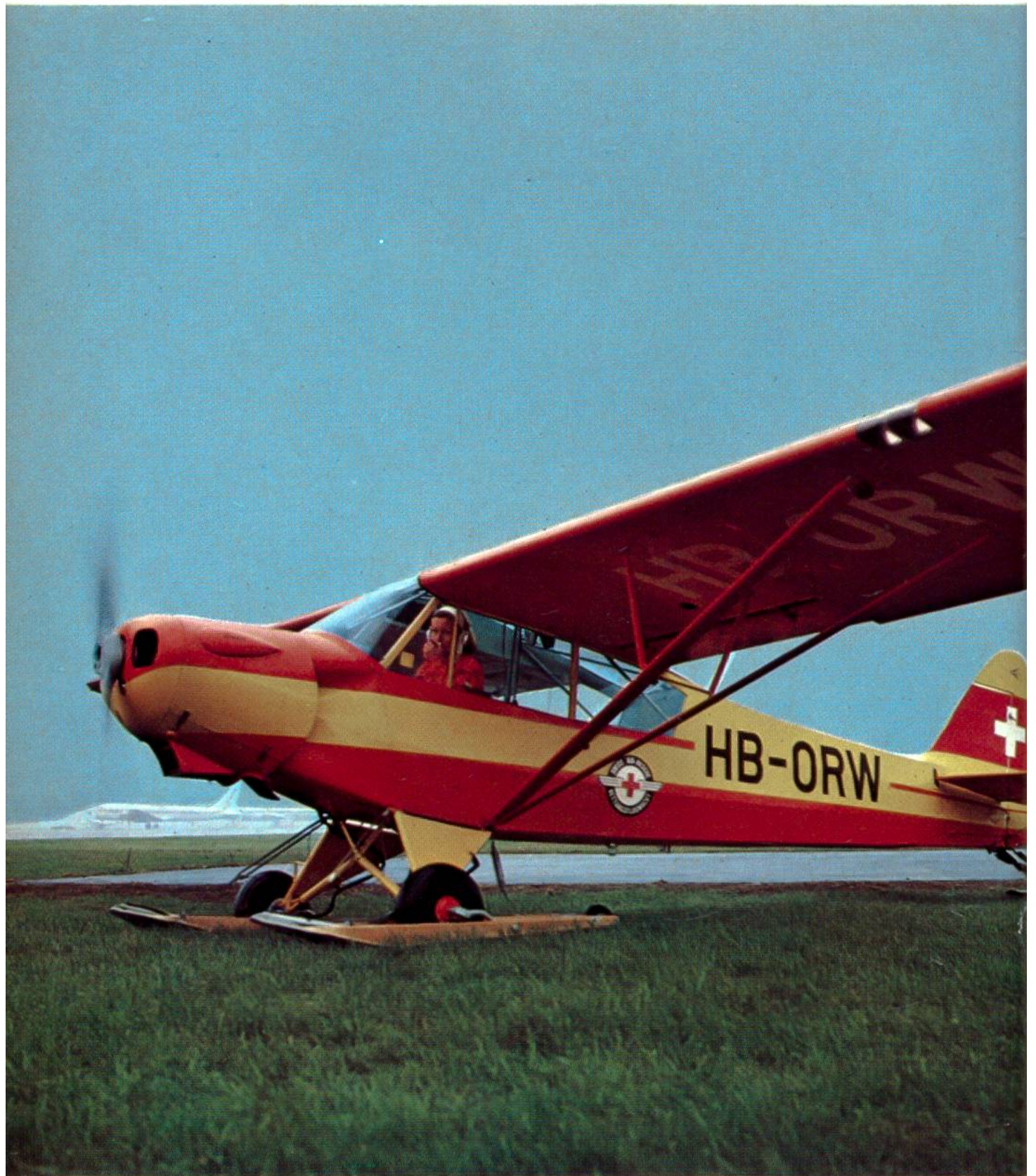
Piper PA-18, Super Cub, zweisitziges Gletscherflugzeug mit Skis.