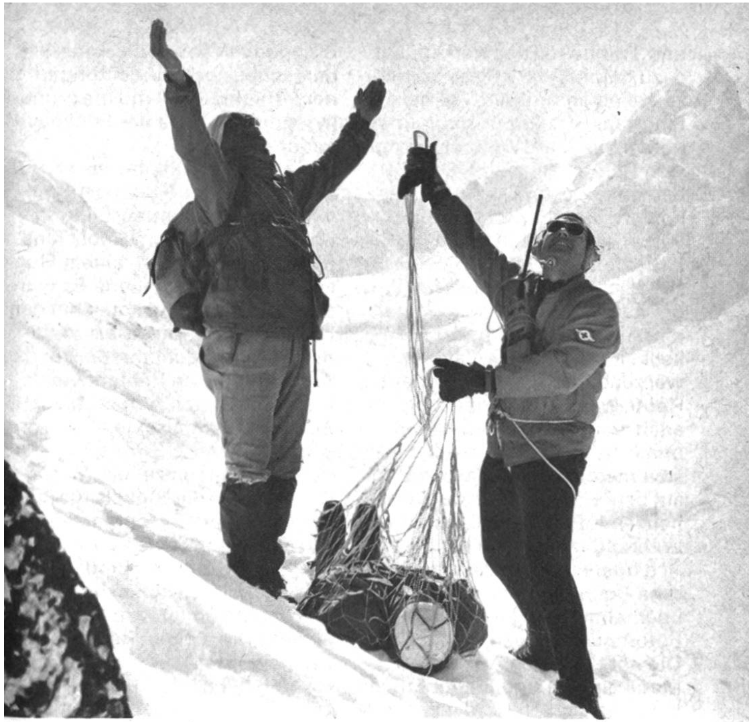
Mittels Funkgerät ruft der Flughelfer den Helikopterpiloten an die Unfallstelle, zum Abtransport des Verletzten.

Gletscherlandetechnik mit Ski- flugzeugen auf. Nachdem 1957 der erste Helikopter für alpine Rettungszwecke eingesetzt wor- den war, liessen sich auch Ret- tungen durchführen, die mit Flä- chenflugzeugen nicht mehr mög- lich waren. Man konnte mit einem Helikopter auf relativ klei-