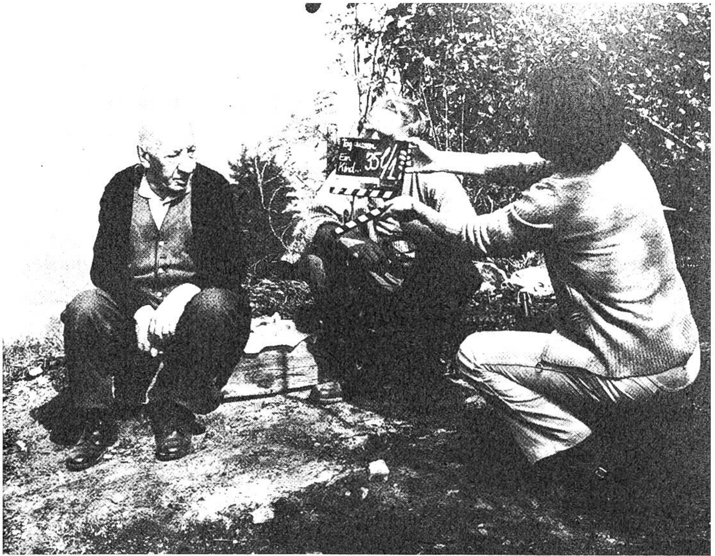
Der Schauspieler Heinrich Gretler bei einer Aussenaufnahme. Jede Szene wird mit der «Klappe» vom Aufnahmeleiter angesagt.

lich. Auf Grund des Drehbuches berechnet er die zu erwartenden Kosten. Da für jedes Fernsehspiel nur eine ganz bestimmte Summe zur Verfügung steht, müssen fast immer zunächst einmal gewaltige Abstriche gemacht, ja ganze Szenen weggelassen werden, damit die Kosten das Budget nicht überschreiten.