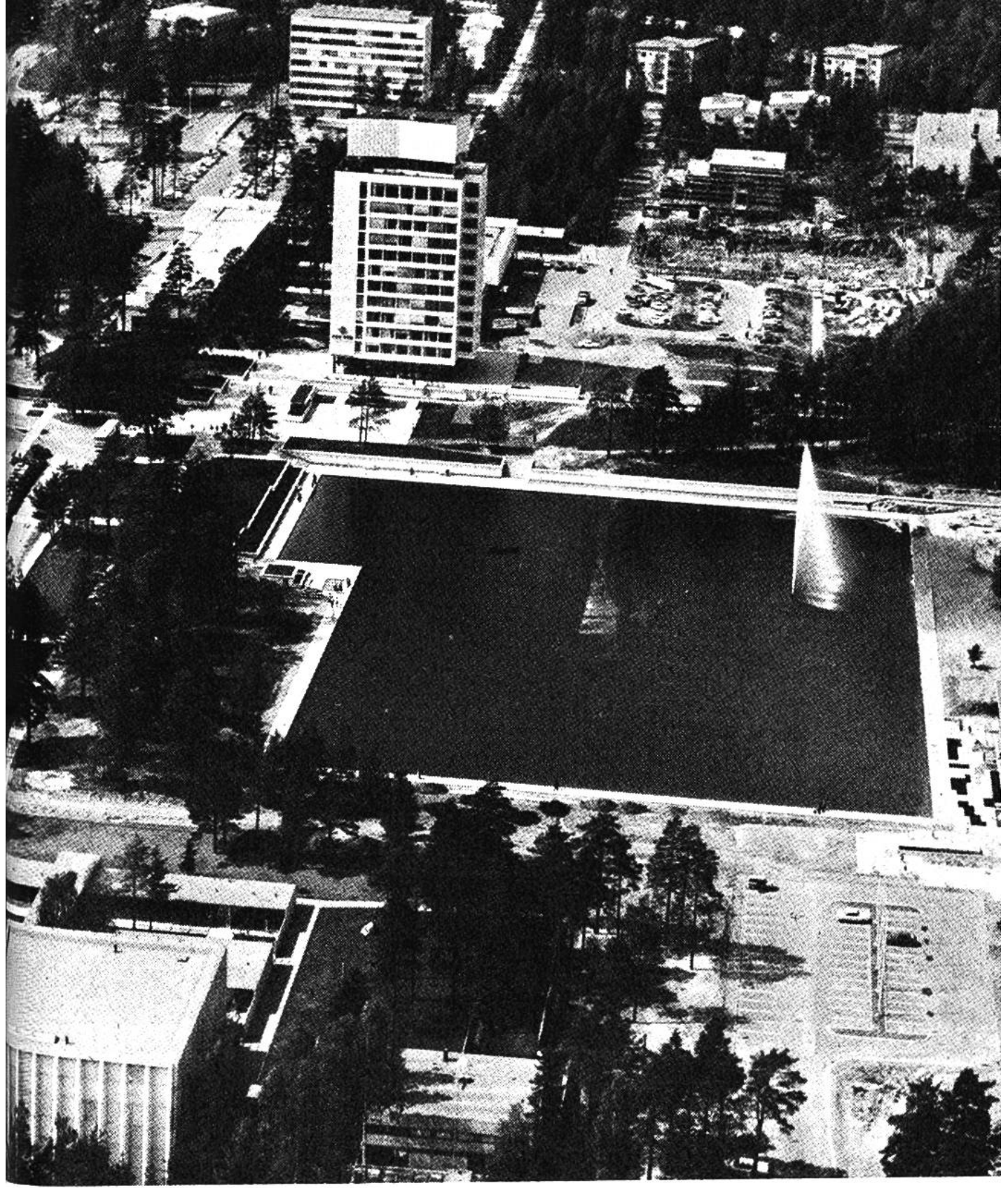
Das ist das Zentrum von Tapiola, der modernen Gartenstadt am Rande der Hauptstadt.