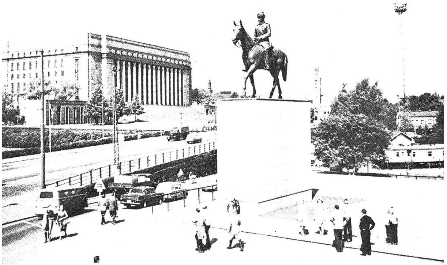
Standbild von Marschall Mannerheim (1867–1951) – Oberbefehlshaber der finnischen Armee, Staatspräsident und heutiger Nationalheld – vor dem Reichstagsgebäude.

schen Nationalkomponisten Jean Sibelius erwähnt. Viele Museen und Ausstellungen locken zum Besuch, Parkanlagen und Vergnügungsplätze zum Verweilen. Die Ausbaupläne Helsinkis sind geradezu einmalig, so soll auf dem Areal des Güterbahnhofs und an einer Bucht direkt neben der bisherigen Innenstadt ein neues Zentrum entstehen. Den Anfang bildet das vor kurzem vollendete Kongress- und Konzerthaus.