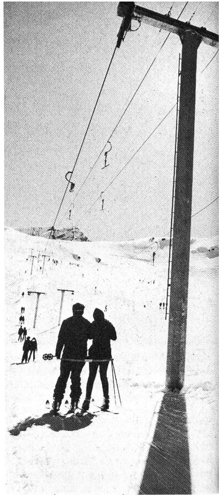
Parallel-Bügelskilift. Die talwärts fahrenden Gehänge schweben hoch in der Luft wieder der Anbügelstation entgegen (Sils/Furtschellas, Engadin).

Kabine für 80 Personen mit Skis, Gehänge und Laufwerk einer Pendelluftseilbahn (Iltios-Chäserugg).