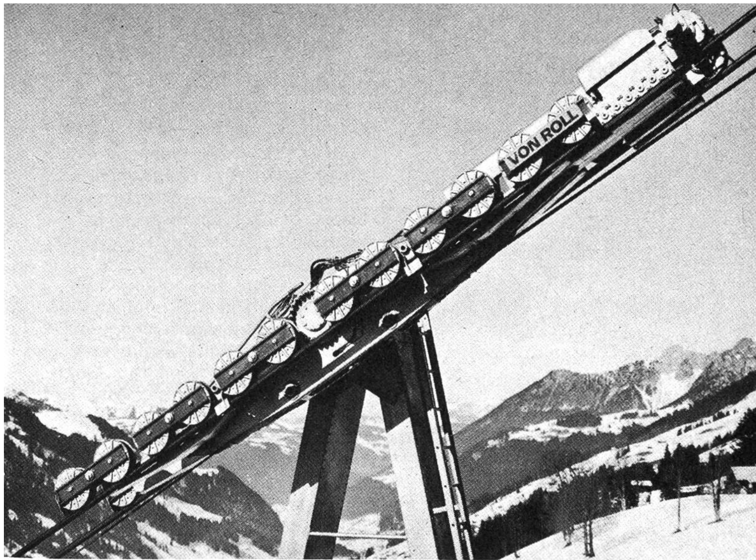
Von-Roll-Laufwerk einer Pendelluftseilbahn, 24rollig, mit angelenktem Bremswagen (Lenk-Metsch).

Gletscherregionen, sind in den letzten zwanzig Jahren wie Pilze aus dem Boden geschossen und haben wesentlich zur raschen Entwicklung des Wintersports und der Wintersportorte beigetragen.