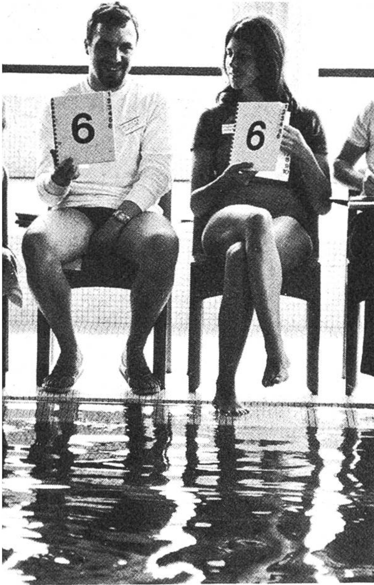
Im Pflichtprogramm sitzen die Wettkampfrichter nebeneinander am Bassinrand und bewerten jede Figur mit den Noten 0–10. Es können auch halbe Punkte gegeben werden.

Pflicht- sowie das Kürprogramm. Beim Pflichtprogramm gibt es ungefähr vierzig Figuren, die alle vier Jahre von einer internationalen Kommission bestimmt werden. Vor dem Wettkampf werden dann fünf davon ausgewählt, die jede Konkurrentin den Richtern vorzuführen hat. Zu diesen vierzig Pflichtfiguren lernt sie mit der Zeit