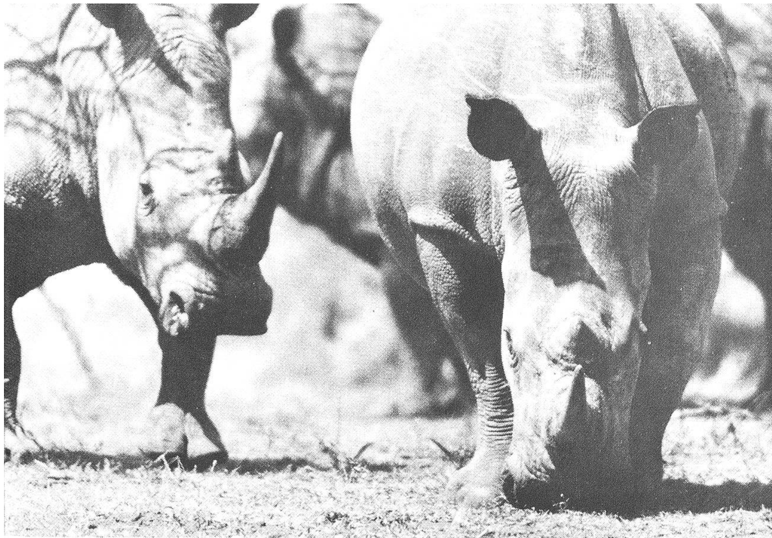
Wie friedliche Kühe weiden die schweren «Burschen».

zwei Möglichkeiten: einerseits die Umsiedlung von Tieren in andere Schutzgebiete, wobei sich auch dort im Verlaufe der Jahre das gleiche Problem wieder eingestellt hat oder einstellen wird, andererseits der Verkauf von Nashörnern an zoologische Gärten in der ganzen Welt. Aber auch dieser Alternative sind Grenzen gesetzt. Am 7. Oktober 1941 ist im Brookfield-Zoo das erste Nashorn zur Welt gekommen. Dem ersten Nashornbaby folgten bald weitere, und bereits sind in den zoologischen Gärten weit über 100 Nashörner geboren worden. Die Zoos sind somit zu Selbstversor-