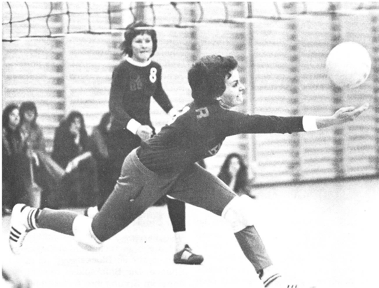
Erlaufen eines Lobballs und einarmiges Zuspiel (erste Ballberührung).

Abwehr des Aufschlags – Stellen – Angriff – Block – Feldverteidi- gung.