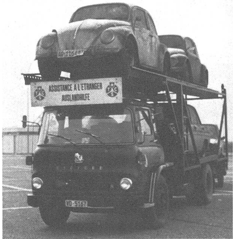
Rücktransport in die Schweiz von Autos, die nicht mehr fahrfähig sind.

schwere Brandverletzungen erlitten. Einen Tag nach dem tragischen Vorfall erhielt die Alarmzentrale von den Schweizer Behörden, die durch deutsche Touristen von diesem Unfall gehört hatten, ein Telegramm. Demzufolge ereignete sich die Gasflaschenexplosion am 12. Oktober in Rishikesh, einem kleinen Dorf, in dem G.B. und C.M. unter primitivsten Verhältnissen notdürftig gepflegt wurden. Zwei Tage später überführte man die beiden Schwerverletzten nach Neu-Delhi. Dort konnte man in einer Klinik die ersten dringendsten chirurgischen Eingriffe vornehmen.