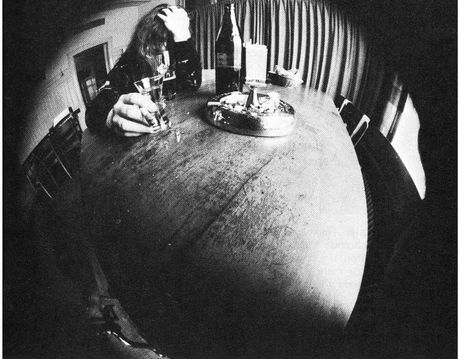
Immer mehr Jugendliche proben den Griff zur Flasche.

erste Stange Bier auch wirklich schmeckt. Aber die Tatsache, dass in unserm Nachbarland Deutschland laut Umfragen drei Viertel aller Kinder unter 12 Jahren bereits Erfahrungen mit Alkohol haben, sollte uns doch zu denken geben. Spezialisten geben weiterhin an, dass ein Sechstel aller Jugendlichen zwischen 10 und 18 Jahren alkoholgefährdet ist. Das sind Zahlen, die auch uns stutzig machen sollten, denn obwohl wir in der Schweiz noch nicht so weit sind, ist der Trend