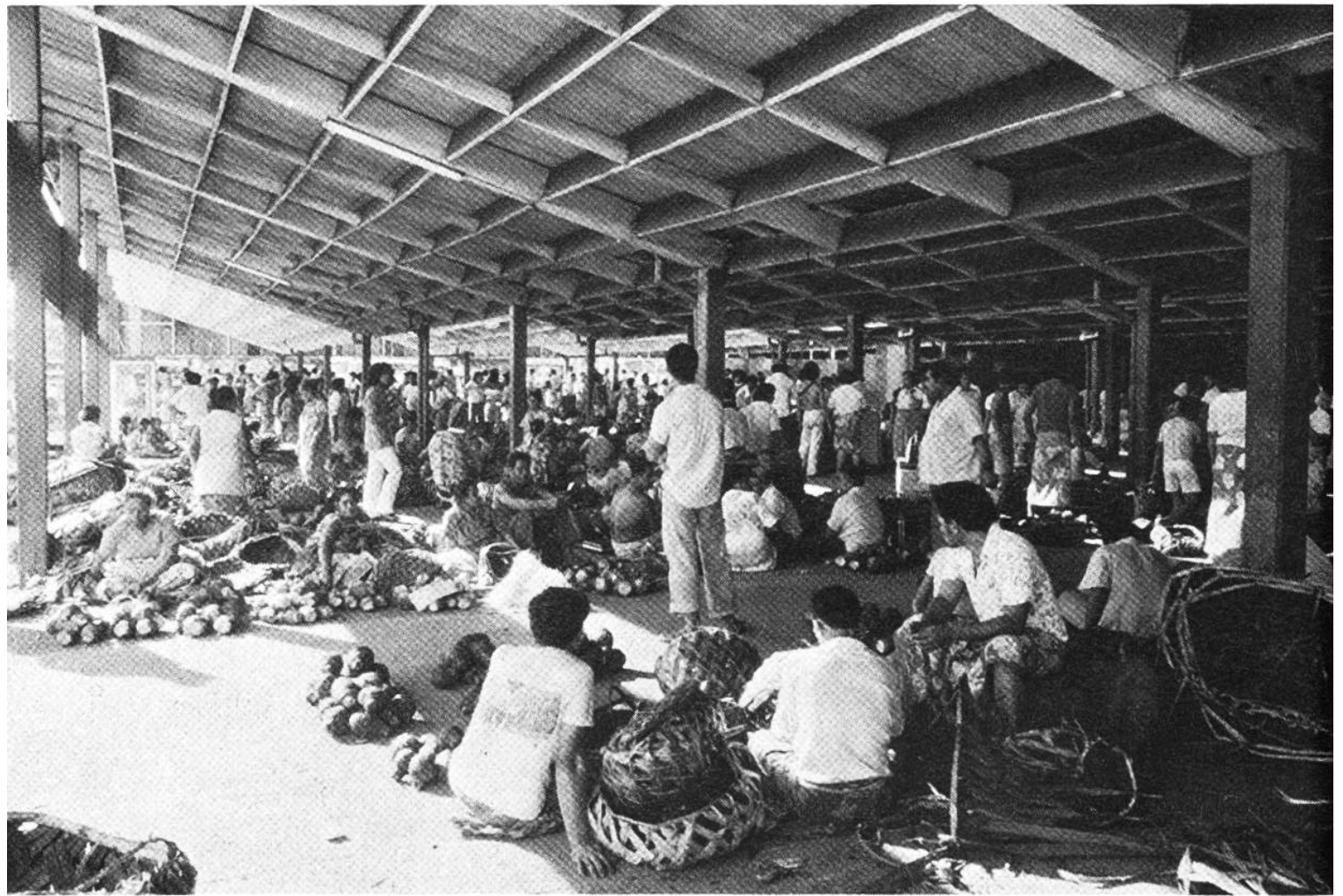
In der Markthalle von Apia, der Hauptstadt von West-Samoa, herrscht ein reichliches Angebot aus der üppigen Natur der Südsee, wobei Früchte, Gemüse und Fische im Vordergrund stehen.

besuchen will, muss sich verpflichten, englisch zu sprechen, auch in der Pause und mit den Schulkameraden. Wer ertappt wird, dass er in seiner Muttersprache flüstert, kann aus der Schule ausgeschlossen werden! Die Insel erscheint wie ein riesiger Garten oder ein Park. Reihenweise stehen hohe, schlanke Kokosnusspalmen. Dazwischen entdecken wir die typisch samoanischen Häuser: ein Längsbau mit palmengedecktem Dach dient als Haupthaus. Aufgerollte Bastmat-