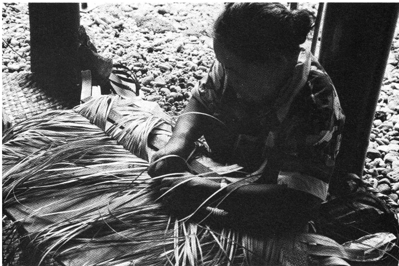
Im Volkskundemuseum von Pago Pago zeigen Frauen den Kindern American Samoas das Handwerk ihrer Ahnen, wie es die Nachbarn auf West-Samoa heute nach wie vor im Alltag praktizieren.

Minuten wütet ein tropischer Gewittersturm und fegt mit gewaltigen Regengüssen über die Insel. Gleich darauf aber strahlt wieder die Sonne, und die Landschaft glänzt wie frisch poliert. Samoaner können genau gleich reagieren. Sie erwarten, dass man ihre Bräuche respektiert. Die meisten von ihnen leben in althergebrachter Weise in grossen Familiengruppen zusammen. Ein von allen gewählter und respektierter Matai (Häuptling) organisiert das Zusammenleben. Jeder