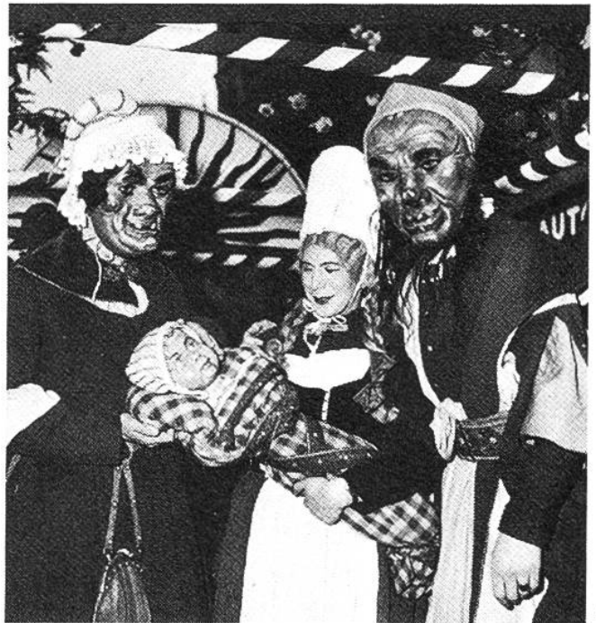
Alte Bräuche werden an vielen Orten der Schweiz alljährlich gefeiert. Unsere Bilder weisen auf vier solcher Brauchtumsfeste hin.

Welches der vier Bilder zeigt nun das Frühlingsfest der Zürcher, das «Sechseläuten»? 1 / 2 / 3 / 4