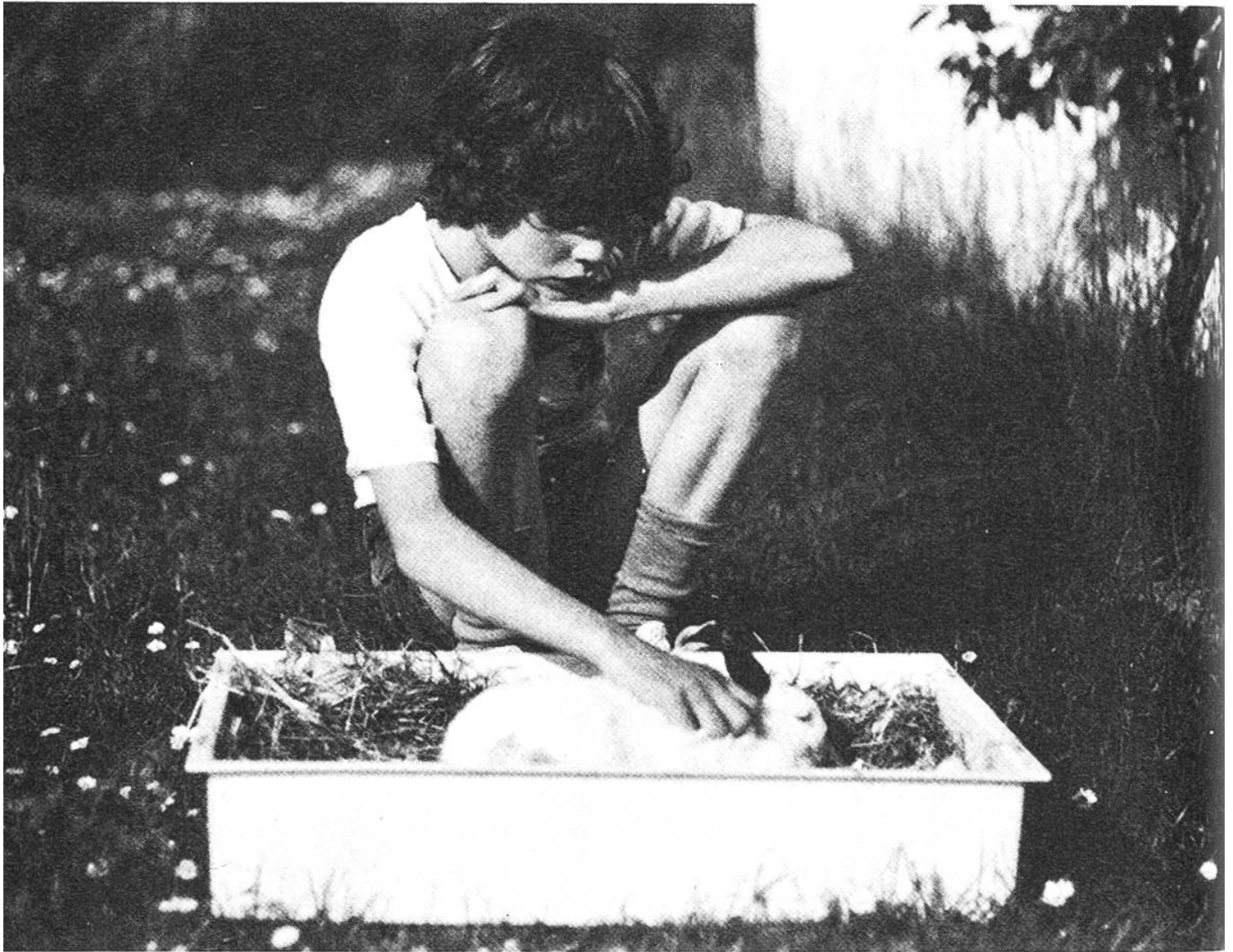
Das Kaninchen braucht sehr viel Liebe und Zuneigung.

grössten Zuneigung ist es nicht sicher, dass das Kaninchen zahm wird. Man sollte immer nur Weibchen kaufen, Kaninchenböcke werden meistens sehr böse. Sie fallen ihre Pfleger an und können ihnen ernsthafte Bisswunden zufügen.