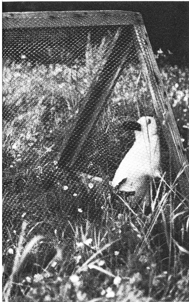
Auf einer Wiese im Garten ist das Kaninchen am glücklichsten.

kann nicht mit Futter verunreinigt werden.