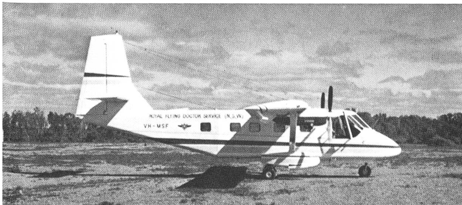
Ein Flugzeug vom Typ Nomad N 22B, aus der Flotte des «Royal Flying Doctor Service».

Was macht man denn nun, wenn auf einem solchen «Outpost» (einsame Siedlung) jemand erkrankt