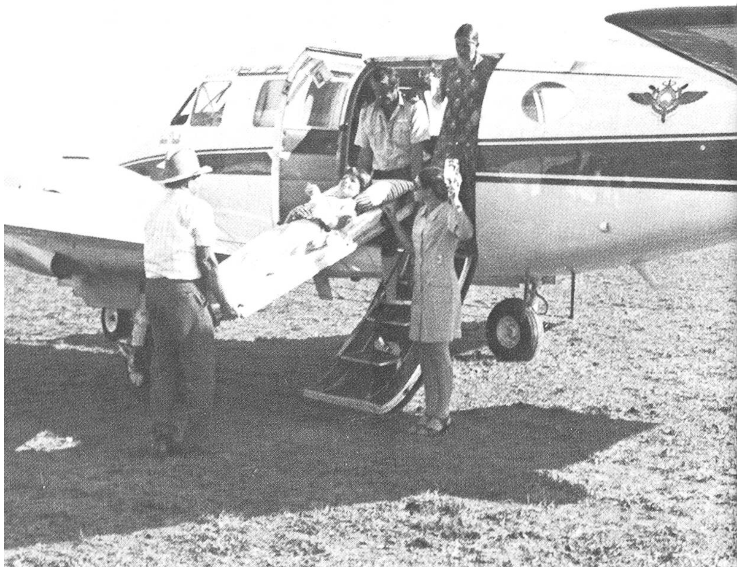
Mit dem «Royal Flying Doctor Service» auf dem Weg ins nächstgelegene Spital. Kann bei so guter Betreuung noch etwas passieren?

nächste Schule ist oft ebenso weit entfernt wie der nächste Arzt. Ebenso werden Themen von allgemeinem Interesse für die sogenannten «Outback Communities» (Pioniersiedlungen) im Landesinnern behandelt. Wenn die Sender abends ihre Programme beschliessen, benützen die Leute in den abgelegenen Gebieten die Gelegenheit, um mit ihren Nachbarn Neuigkeiten auszutauschen. Diese offenen Diskussionen, die natürlich jeder, der