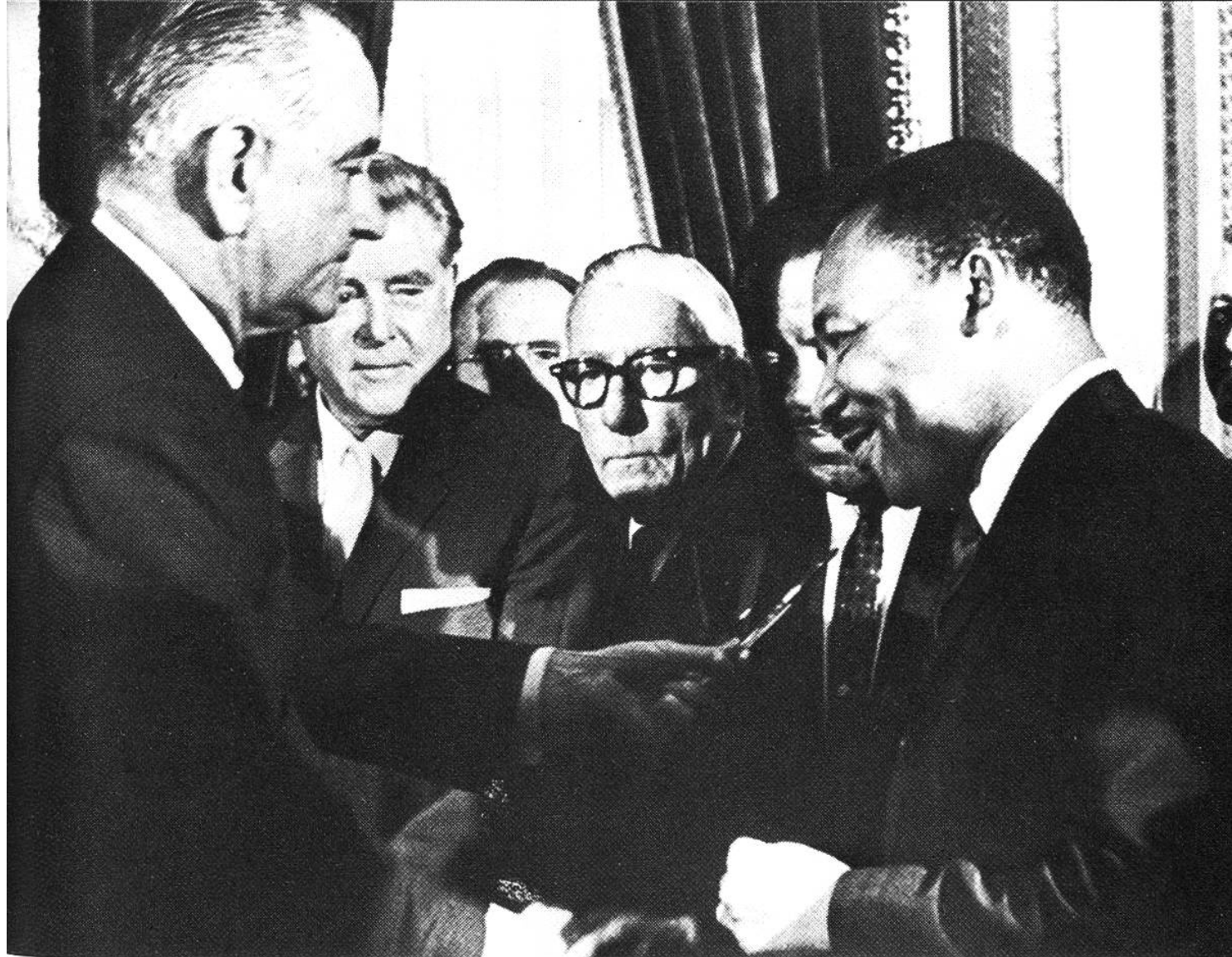
Präsident Johnson und Martin Luther King nach der Unterzeichnung der Bürgerrechtsvorlage, die den Südstaatennegern ihre politischen Rechte garantieren soll.

jeden Tag ausbeutet, wenn man jeden Tag auf uns herumtrampelt: Lasst euch nicht soweit herabziehen, jene, die euch das antun, zu hassen ...», beschwor Martin Luther King seine Mitbrüder. Längst war der amerikanischen Öffentlichkeit klar geworden, dass es bei diesem Streit um weit mehr ging als um die Rassendiskriminierung in den Autobussen.