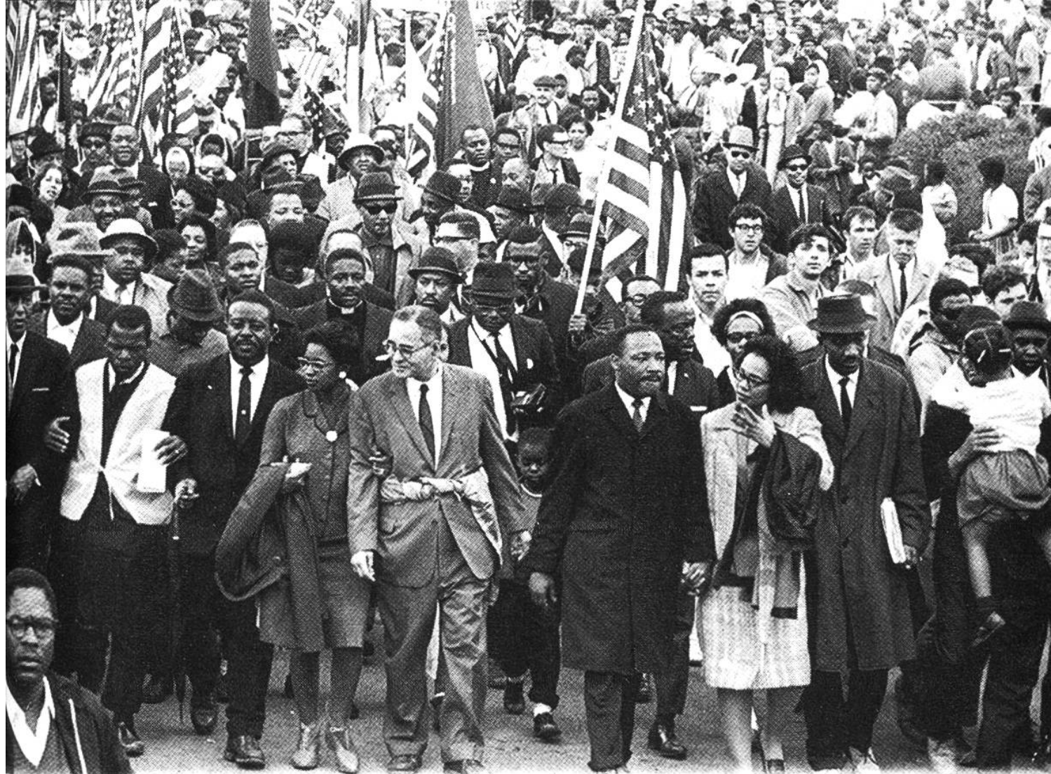
Gewaltlose Demonstration für die Rassenintegration: der Freiheitsmarsch nach Washington.

Luther Kings folgend, mit gewaltlosen Mitteln gegen die Rassentrennung: mit Demonstrationen, mit Sit-ins, mit Einkaufs-Boykotts, mit öffentlichen Gebetsversammlungen. Sie wehrten sich nicht gegen die Schlagstöcke der Polizei, gegen Wasserwerfer und Tränengas, ihre Anführer liessen sich widerstandslos festnehmen und erduldeten die Unbill der Gefängnisse. «We Shall Overcome» — «Wir werden es schon schaffen» wurde die Hymne der schwarzen Bürgerrechtsbewegung. Die gewaltlosen, eindrucksvollen