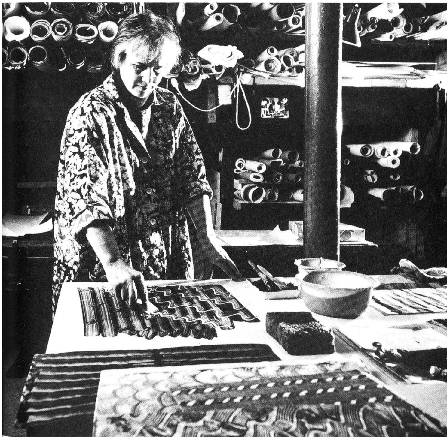
Bei der Herstellung von Kleisterpapier für Bucheinbände und Schachtelüberzüge.

Denn auch das sachkundige Restaurieren von alten Büchern gehört in den Tätigkeitsbereich eines Buchbinders.