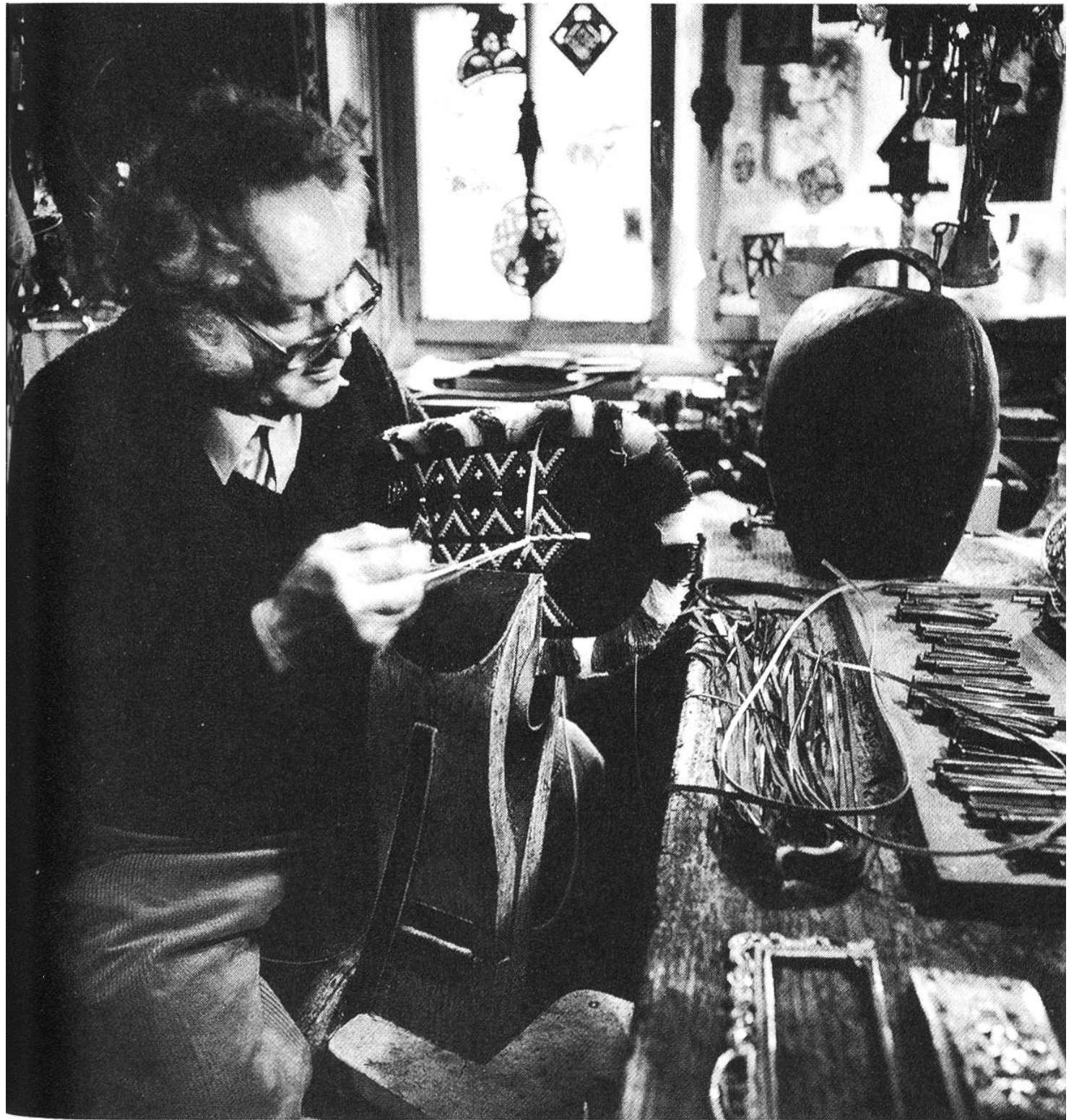
Der Schmuckbeschlag wird mit verschiedenen Punzen ziseliert.

aus und ziseliert sie mit Hilfe verschiedener Punzen (meisselähnliches Werkzeug).