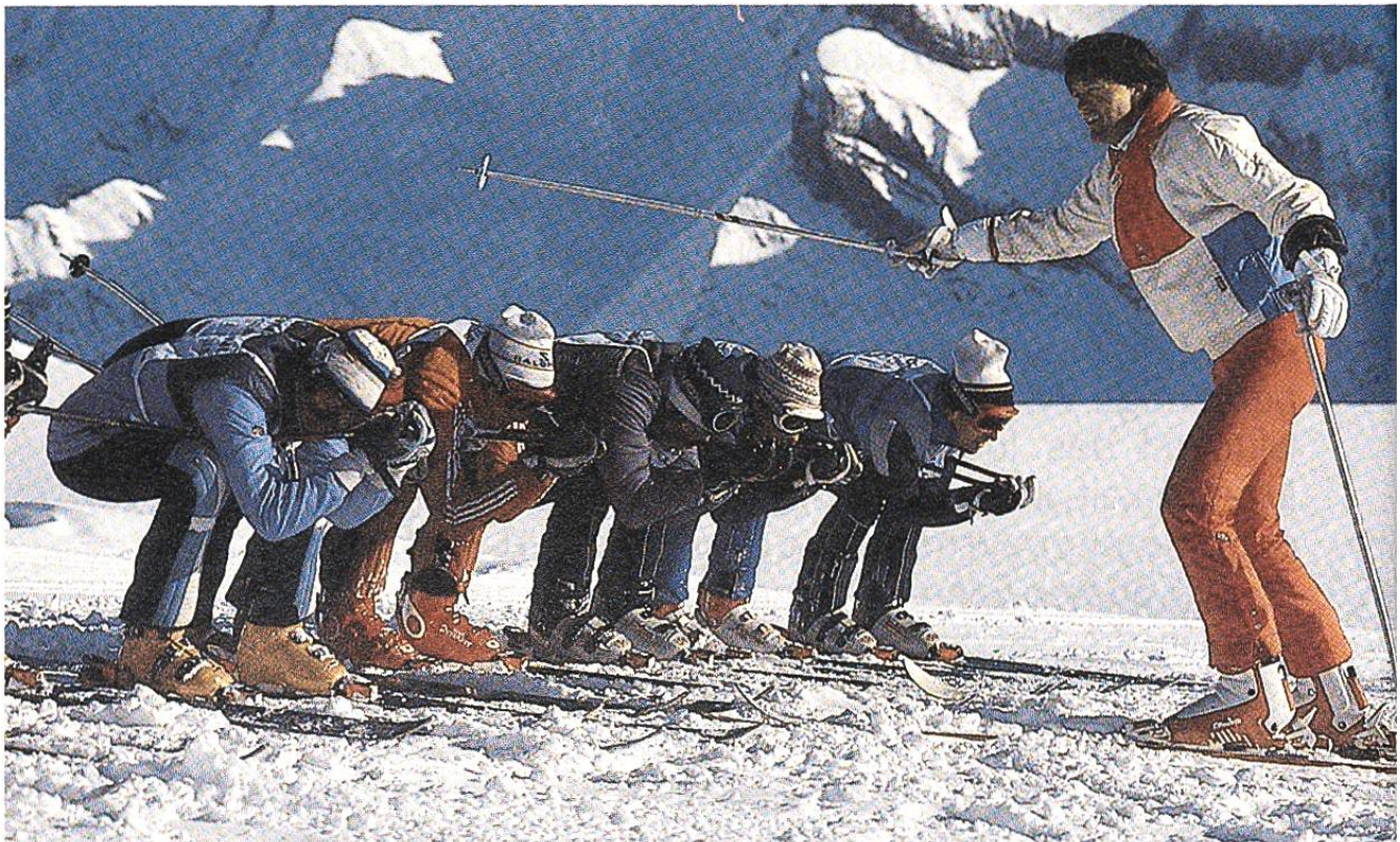
Wer kann sich einen besseren Ratgeber als Weltmeister und Olympiasieger Bernhard Russi wünschen!