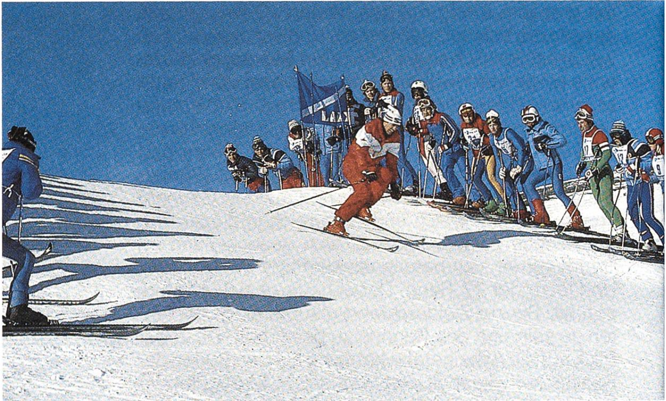
Die richtige Linienwahl kann über Sieg oder Niederlage entscheiden.