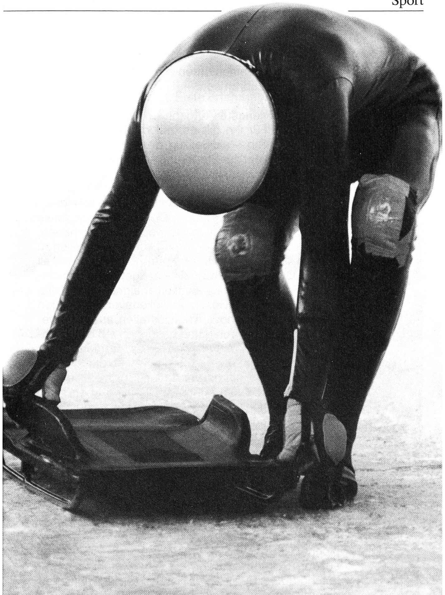
Die besonders Wagemutigen fahren auf dem Cresta Run in St. Moritz auf dem sogenannten Skeleton durch die Eisrinne.