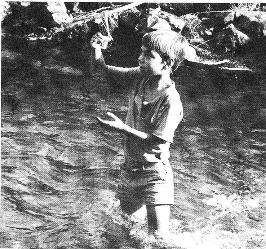
Ein Blick ins Glas: Was wohl alles darin herumschwimmt?

Ein Teil des Materials, welches für Kinder und Jugendliche und vor allem für Schulen bestimmt ist, wird im Schweizerischen Zentrum für Umweltschutz (SZU) in Zofingen hergestellt.