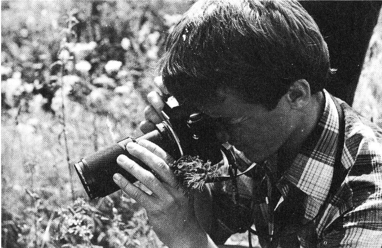
Begegnung mit der Natur: Was erzählt wohl die Blüte?

den Naturschutz, du findest darin das Lagerprogramm und an einem «Anschlagbrett» die Aktivitäten der verschiedenen Jugendnaturschutzgruppen. Zum Beispiel: «Mit dem Velo die Natur erleben» (Jugend-Naturschutz Luzern); «Flusswanderung an Thur und Necker» (JNG St. Gallen); «Orchideen-Weekend» (JNG Aargau); «Biologischer Landbau» (JNG Emmental).