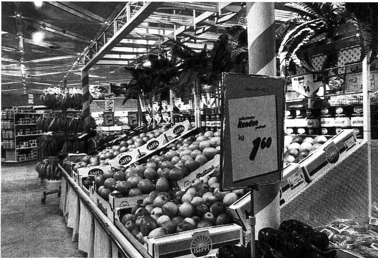
Ein Supermarkt mitten in der Schweiz — es fehlt an keinen Köstlichkeiten aus allen Himmelsrichtungen. Die Jahreszeiten sind aufgehoben.