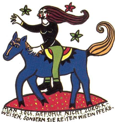
auf Seite 176