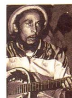
Beat Street, Bob Marley ...