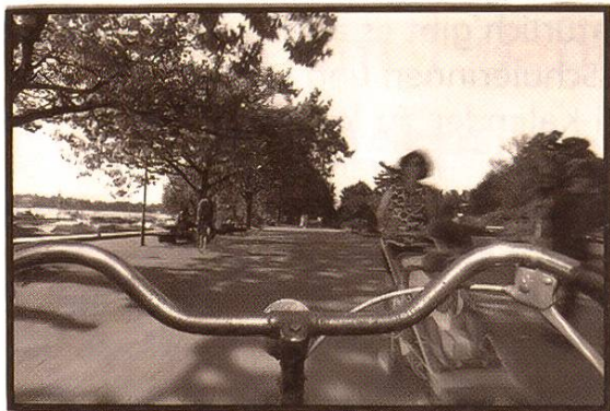
Genau das richtige Tempo – auf Seite 162