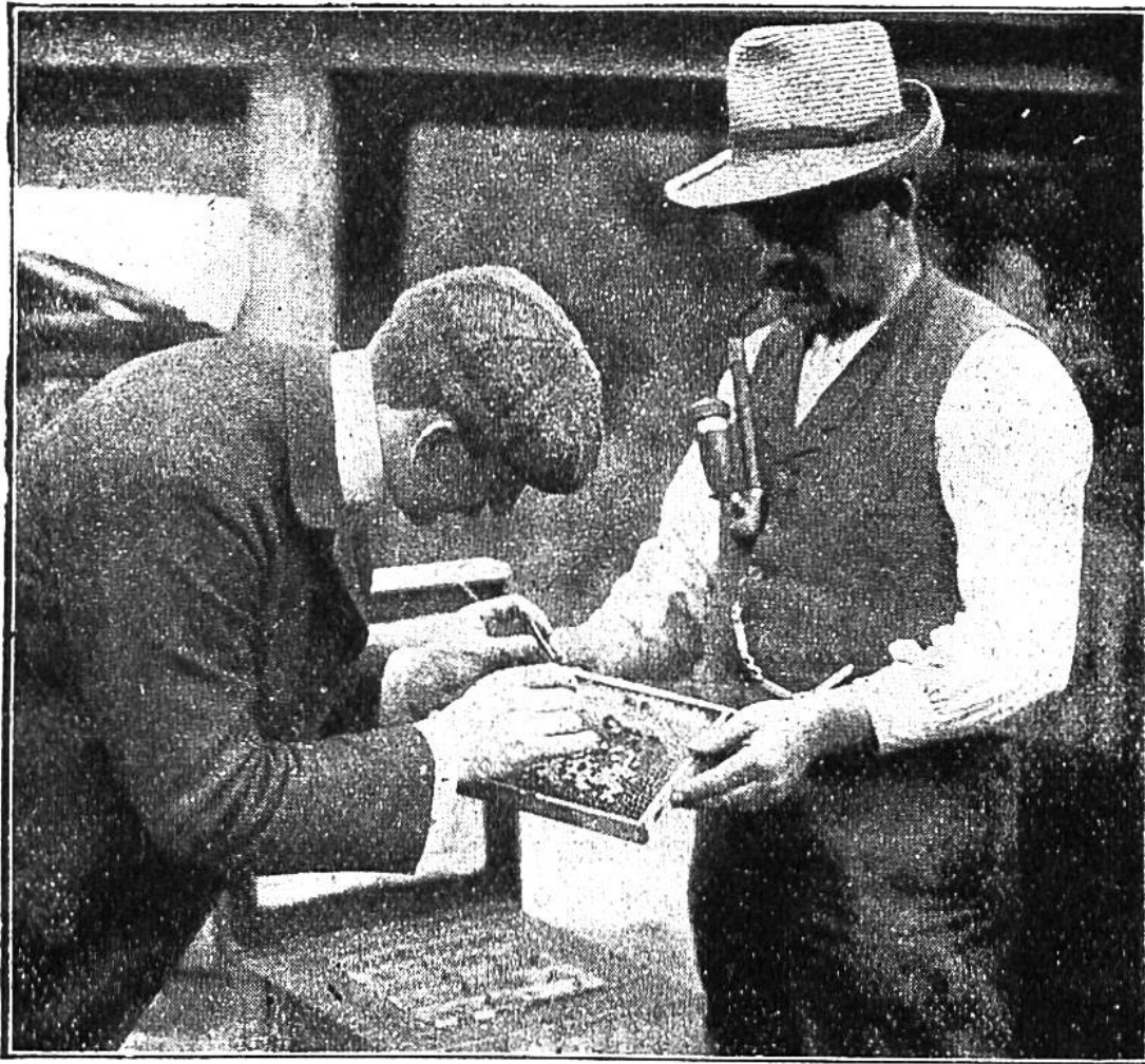
Einsetzen der Bienenkönigin in die Wabe resp. Einsetzen der Larve einer Arbeitsbiene in eine Königinnenzelle, wo sie sich zur Königin entwickelt.

An einem schönen, sonnigen Tage feiert die Königin dann hoch oben im Blau der Lüfte Hochzeit mit den Drohnen. Ausgangs des Sommers folgt nun noch eine höchst abenteuerliche Geschichte, welche die Drohnen, die männlichen Bewohner des Stockes, angeht. Sobald die Luft kühler wird und die Blumen keinen süßen Honigsaft mehr spenden, dann geht es den armen Drohnen ans Leben. Faul und gefräßig hausen sie jetzt völlig überflüssig im Stock, durch den eines Tages die Losung geht: „Auf zum Streit!“, dann werden die Arbeitsbienen den Drohnen zu Richtern und Henkern.