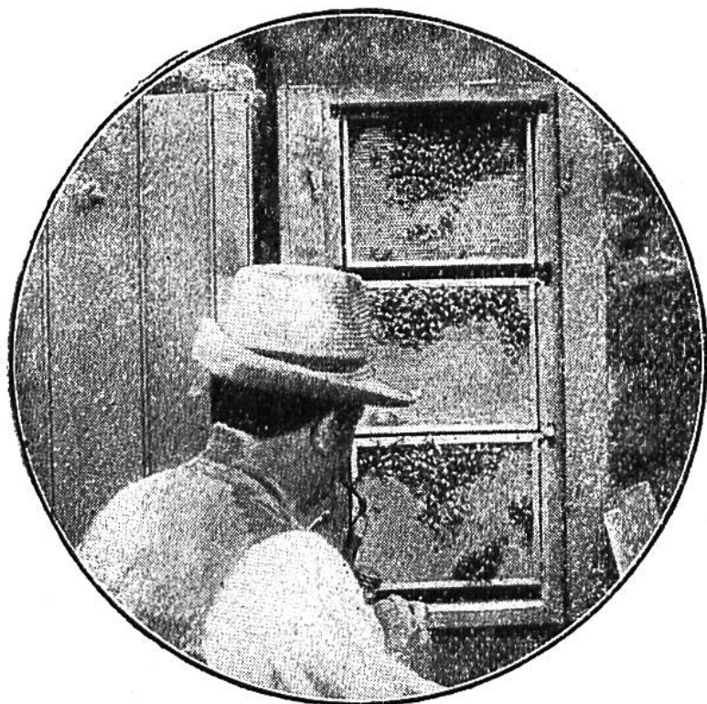
Vor den Waben.

So endet das Strafgericht über diese armen Müssiggänger, die gewohnt waren, sich bedienen zu lassen und die süßen Honigtöpfe zu plündern. Für den Stock und sein Wohl haben sie durchaus keinen Zweck mehr und im Winter, der lang und karg ist, würden sie nur unnütze Mitesser sein.