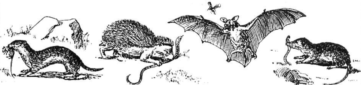
Gr. Wiesel. Fr. 40. —