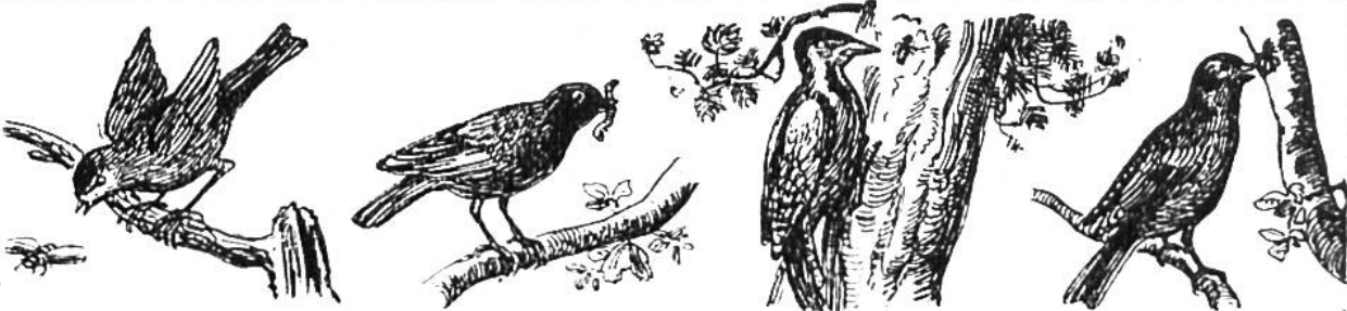
Meise. Fr. 30. —