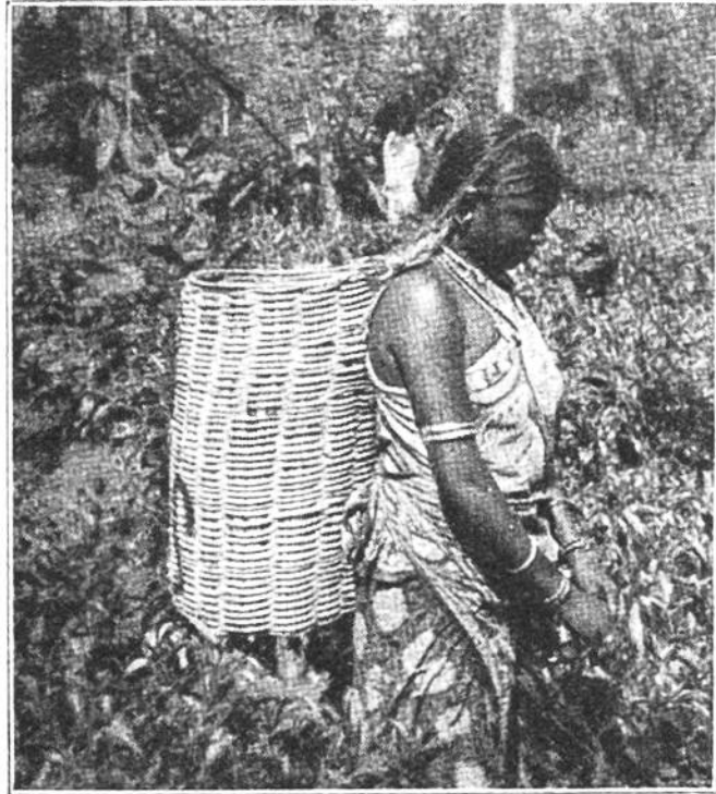
Eine singhalesische Teeleserin in Ceylon.

entwickelt haben, sondern kaum aus den Knospen hervorgetreten sind. Dieser unter Aufsicht von Beamten gepflückte Tee kommt aber nicht nach Europa, sondern wird in China verbraucht. Die folgenden Ernten geben geringeren Tee, die letzte den geringsten, weil die Blätter nach und nach hart werden. Im siebenten Jahre sucht man den Strauch zu verjüngen, das heisst man schneidet ihn ähnlich wie unsere Obstbäume bis auf einen Zweig kahl und bewirkt so, dass junge Triebe hervorbrechen, oder aber man ersetzt die Pflanzen durch neue.