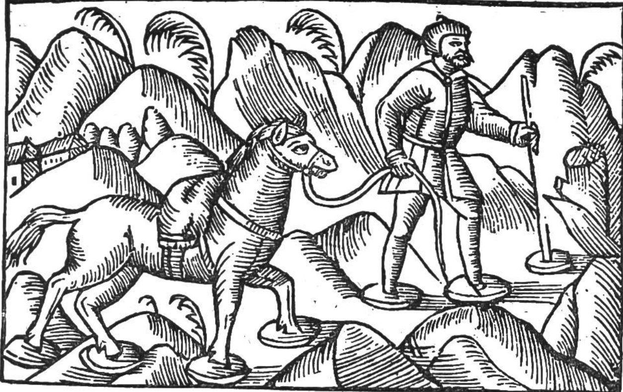
Mann und Ross mit Schneereifen im Gebirge. (Aus dem Buche des Claus Magnus, 1567, Basel.)