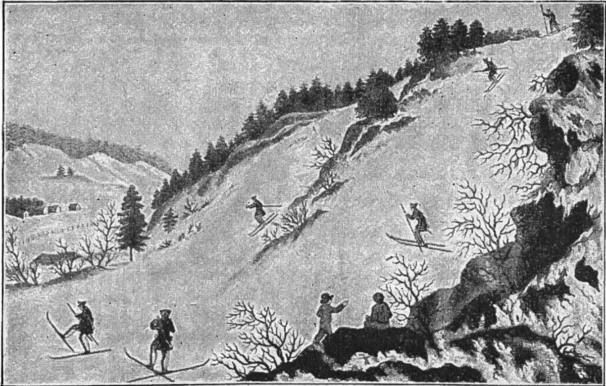
Norwegische Militär-Skiläufer im 18. Jahrhundert. (Nach einem alten Stich.)

bis der Skifahrer genug hatte und sagte: „So probiert ihr, wenn ihr's besser wisst“, aber sie konnten es auch nicht besser. Noch einige Male versuchten wir's, jedoch ohne über die ersten Anfänge hinaus zu kommen; denn es fehlte uns jede Anleitung. Nicht gefehlt hat es uns jedoch an Zuschauern und bissigem Spott. Da verging uns die Lust. Wir waren um eine Enttäuschung reicher und erklärten, als Leute, welche die Sache praktisch erprobt hatten, das mit dem Springen und blitzschnellen Fahren sei ein elender Schwindel. Die arg verkannten Ski wurden verächtlich bei Seite gestellt.