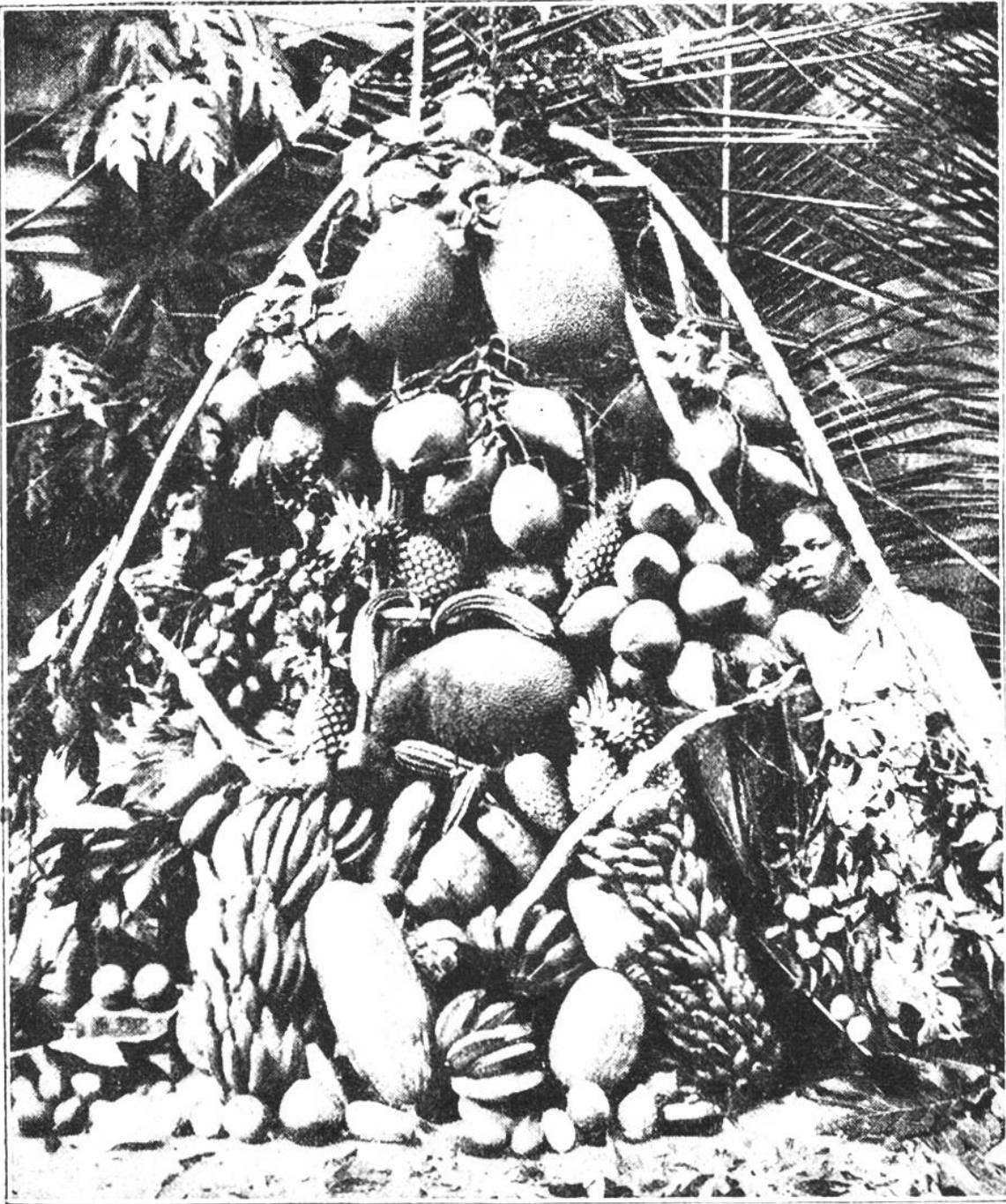
Fruchtreichtum auf Ceylon.

leicht ist aber der Tag nicht fern, wo dank rascherer Spedition und der Anwendung wissenschaftlicher Verfahren in der Aufbewahrung, die tropischen Früchte auf unsern Märkten erscheinen. Es bleibt dann nur zu wünschen, dass der Preis ein mässiger bleibe. In Ceylon haben die Früchte so geringen Wert, dass ihr mit ein paar Nickelstücken und ein wenig markten Eigentümer des ganzen hier abgebildeten Fruchtstandes werden könntet.